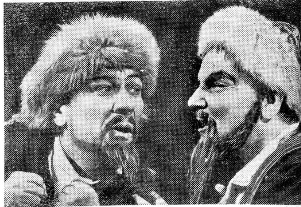
Винницкий государственный украинский музыкально-драматический театр показал зрителям пьесу казахского драматурга Мусрепова «Поэма о любви».