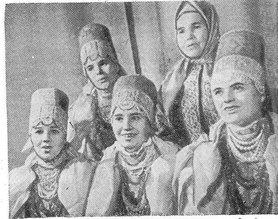
В Архангельской области проходит телевизионный фестиваль самодеятельного искусства, посвященный 50-летию образования Союза Советских Социалистических Республик. Участвуют в фестивале и самодеятельные артисты села Карпогоры.