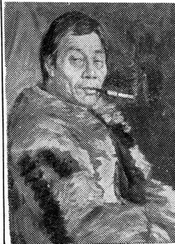
МОСКВА. В Центральном выставочном зале столицы открылась выставка произведений художников Сибири, Урала и Дальнего Востока. На выставке представлены все виды художественного творчества. В экспозицию включены лучшие произведения последних лет. Этой выставкой Союз художников РСФСР начинает показ изобразительного искусства Российской Федерации в преддверии празднования 50-летия образования Союза Советских Социалистических Республик.