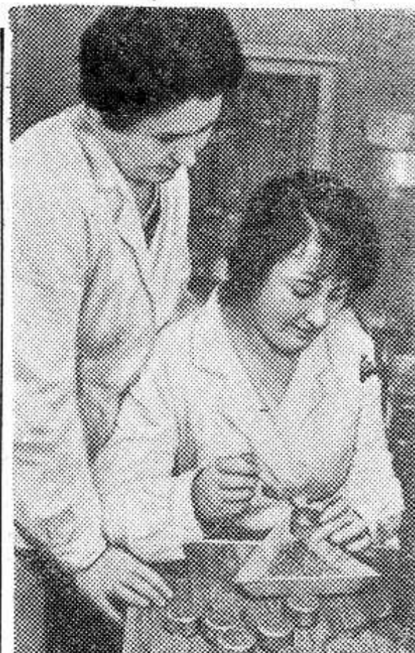
Проверку семян колхозов и совхозов на посевные качества проводят сотрудники Калужской государственной семенной инспекции.

доярки Столбовской фермы колхоза «Авангард».