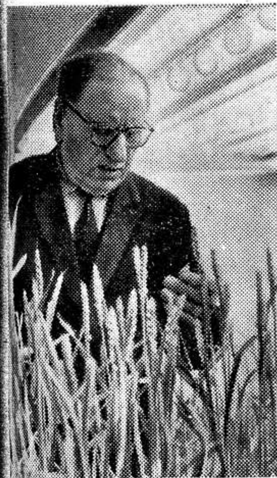
П. П. Лукьяненко. Среди них всемирно известные пшеницы «безостая-1», «Аврора», «Кав- каз».

Сейчас академик и его уче- ники — сотрудники Краснодар- ского научно-исследователь- ского института сельского хо- зяйства — заняты созданием новых перспективных сортов пшениц полукарликового и карликового типа с короткой плотной соломокой и крупным колосом. Решается одна из сложных научных проблем — выведение так называемых ге- торозисных гибридных пшениц повышенной продуктивности.