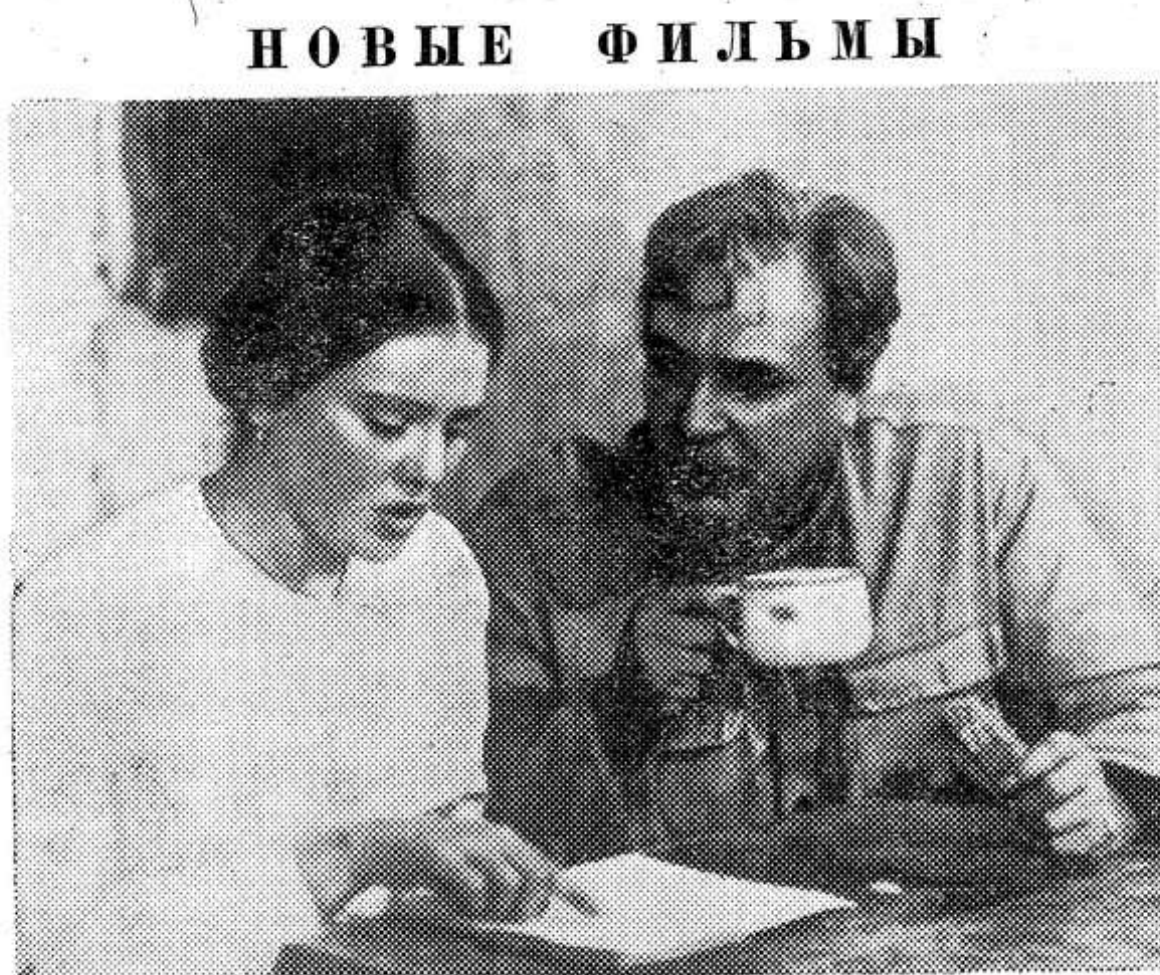
Фликты переплетаются с личной драмой героев. Одна из важнейших в фильме тем — раскрепощение женщины.

ма. Анна — артистка Ж. Прохоренко, Арсений — артист Е. Матвеев.