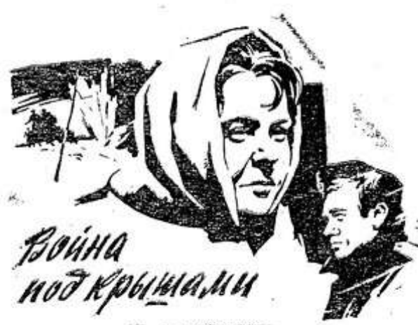
ВОЙНА ПОД КРЫШАМИ

Экранизация двух ранних рассказов Михаила Шолохова — «Смертный враг» и «Двумужья».