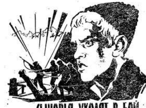
СЫНОВЬЯ УХОДЯТ В БОЙ

Эти два фильма рассказывают о трагической и героической судьбе белорусской подпольщицы.