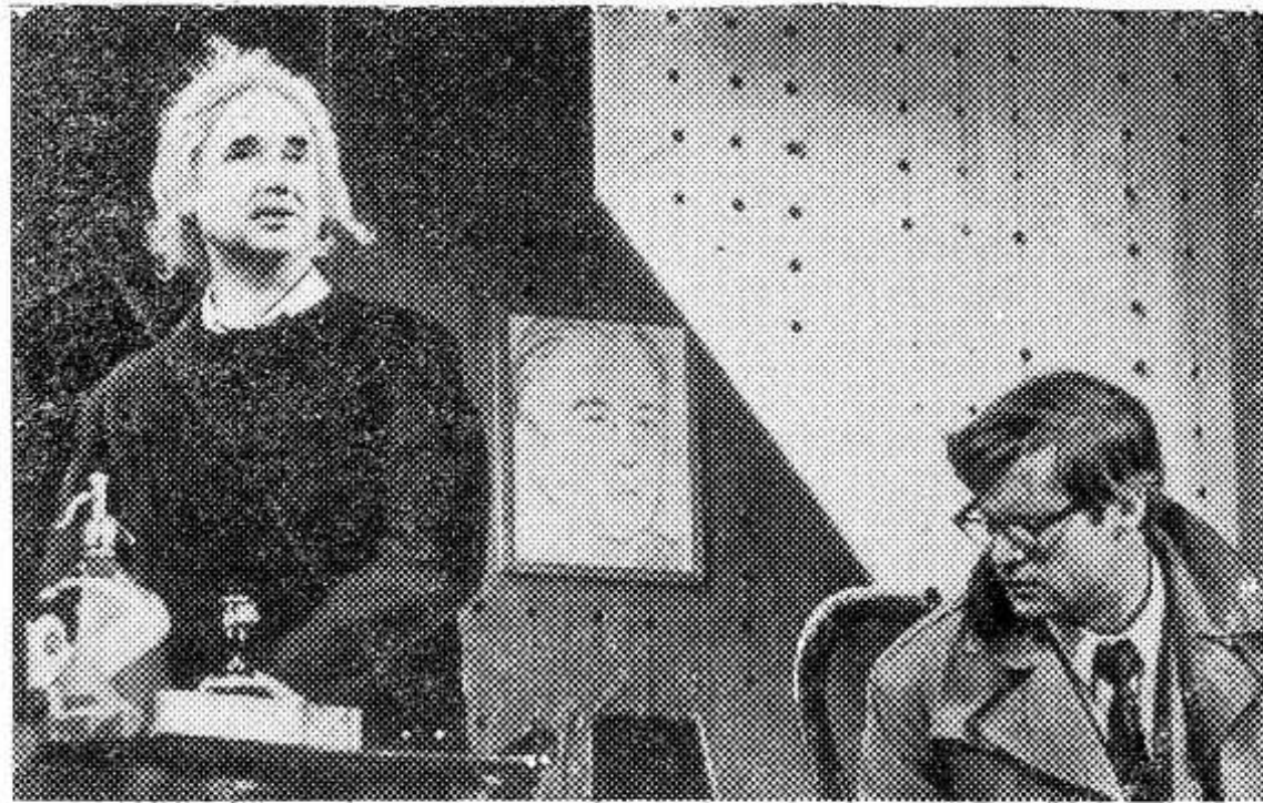
МОСКВА. Коллектив Драматического театра имени К. С. Станиславского заканчивает работу над пьесой Н. Погодина «Альберт Эйнштейн».

Постановку этого спектакля впервые на столичной сцене осуществляет главный режиссер театра И. Т. Бобылев, художник — Т. А. Элиава.