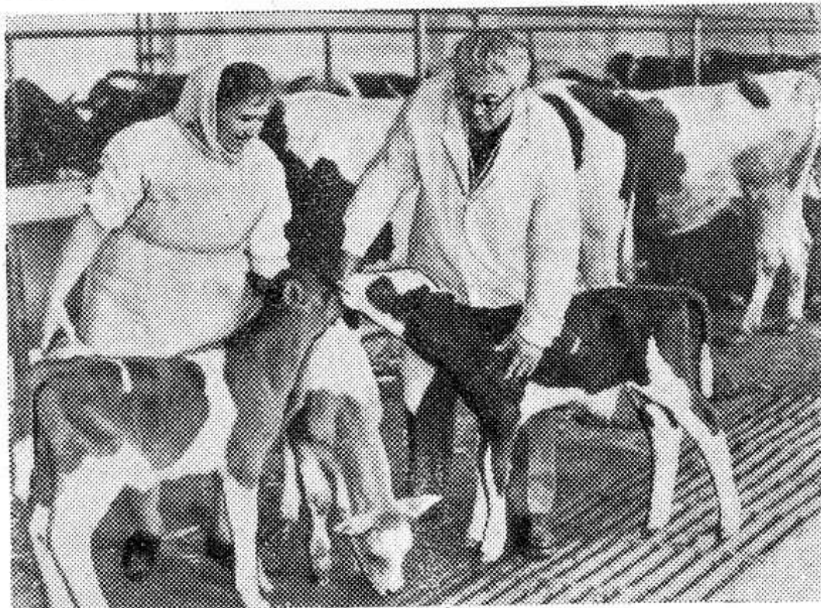
Молдавская ССР. За околицей села Новые Анепы, как заводские корпуса, стоят животноводческие помещения совхоза «Березовский». В новый комплекс входят двенадцать коровников для 1400 животных и два телятника, ветеринарная лечебница и три родильных помещения, завод по переработке молока, Дом животновода. В коровниках все трудоемкие процессы механизированы. Машины готовят корм и раздают корма, убирают помещения, автоматы создают микроклимат. Надои за год в среднем от каждой коровы составят 3600 килограммов.