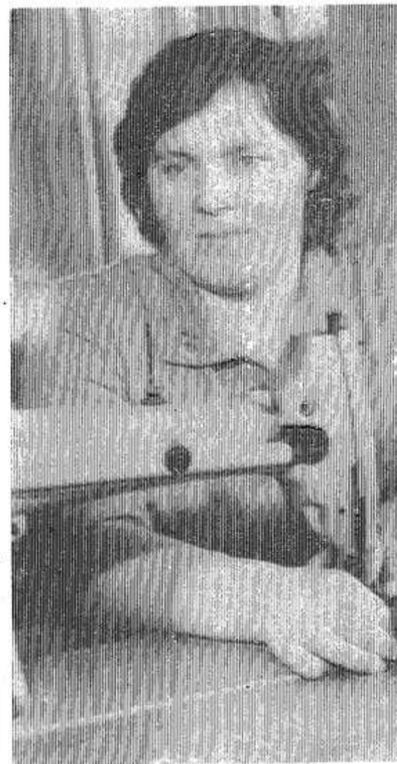
Нередко заказчица, придя в комбинат бытового обслуживания населения, просят: