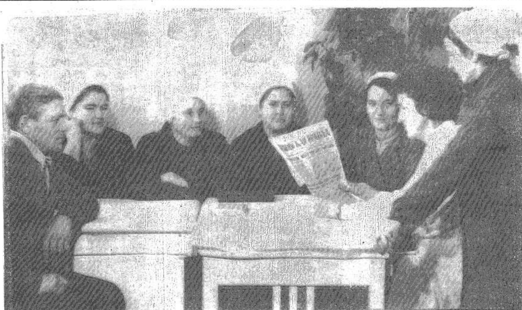
Материалы сессии Верховного Совета СССР, на которой рассматривались вопросы развития народного хозяйства страны в текущей пятилетке, привлекают внимание всех тружеников района.