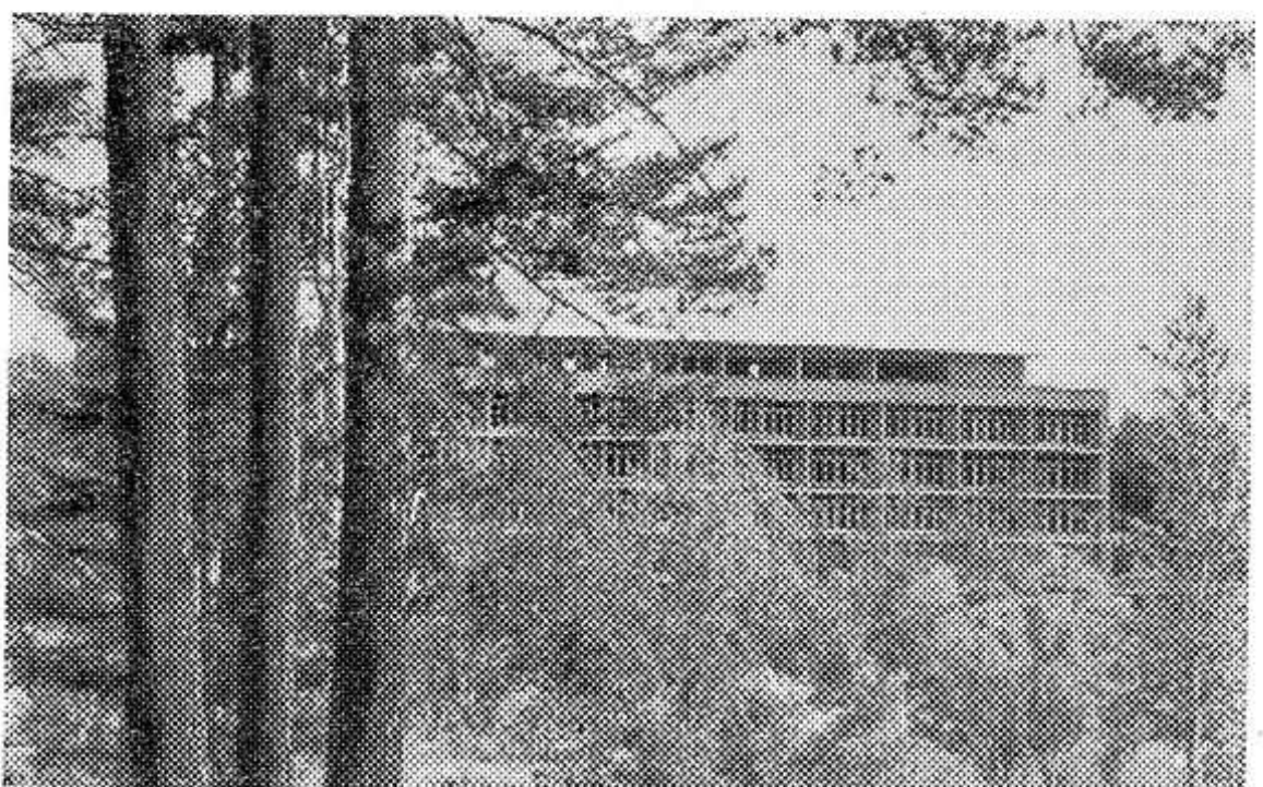
В Пермской области на базе известного своими лечебными водами курорта Усть-Качка строится межколхозный санаторий на 250 мест.