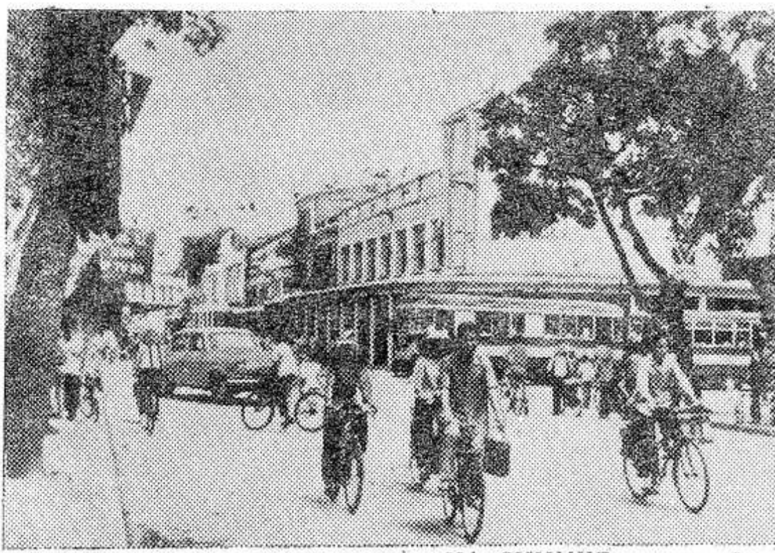
НА СНИМКЕ: на одной из улиц Ханоя.

Перезвон трамваев, сигналы машин, крики разносчиков зелени, смех детей, музыка, льющаяся из уличных репродукторов, — будничное многоголосье большого южного города. Таков Ханой сегодня. Но небо вьетнамской столицы еще не стало мирным. Защитный цвет войны все еще основной цвет города. На крышах многих зданий Ханоя и его пригородов видны стволы зенитных пулеметов, на улицах — бомбоубежища, не покинули своих позиций тяжелые зенитные орудия и ракетные установки, образующие щит противовоздушной обороны столицы ДРВ, проводят учения бойцы отрядов самообороны. Времени от времени над городом пролетают самолеты, Ханой на чеку. Ведь почти каждый день американская авиация на-