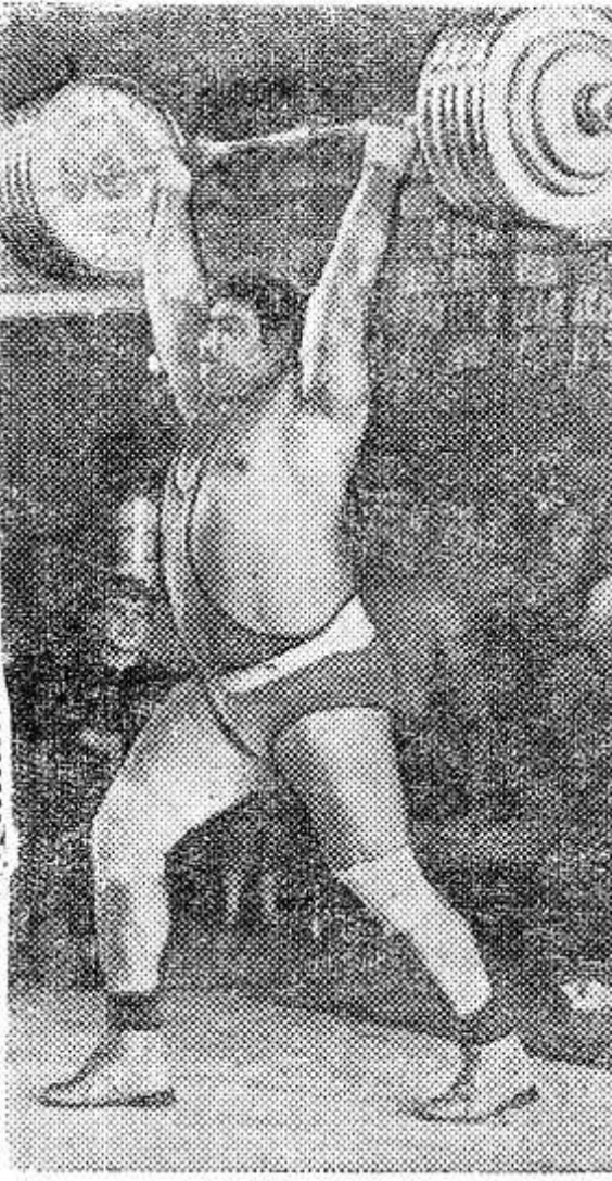
Мировые рекорды в жиме (225,5 кг), рывке (180 кг), толчке (235 кг) и греборье (640 кг) для штангистов второго тяжелого веса установил Василий Алексеев. НА СНИМКЕ: В. Алексеев во время выступления.