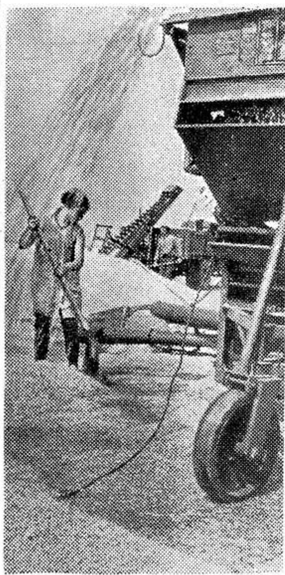
Одесская область. Хороший урожай озимой пшеницы и ячменя выращен в колхозе «Победа» Саратовского района. В среднем на круг здесь намалачивают свыше 36 центнеров зерна с гектара. А обязательство хлеборобов — собрать не менее 32 центнеров озимой пшеницы с гектара. Намолоты показывают, что обязательства будут перевыполнены.

НА СНИМКЕ: очистка зерна перед отправкой в государственные закрома.