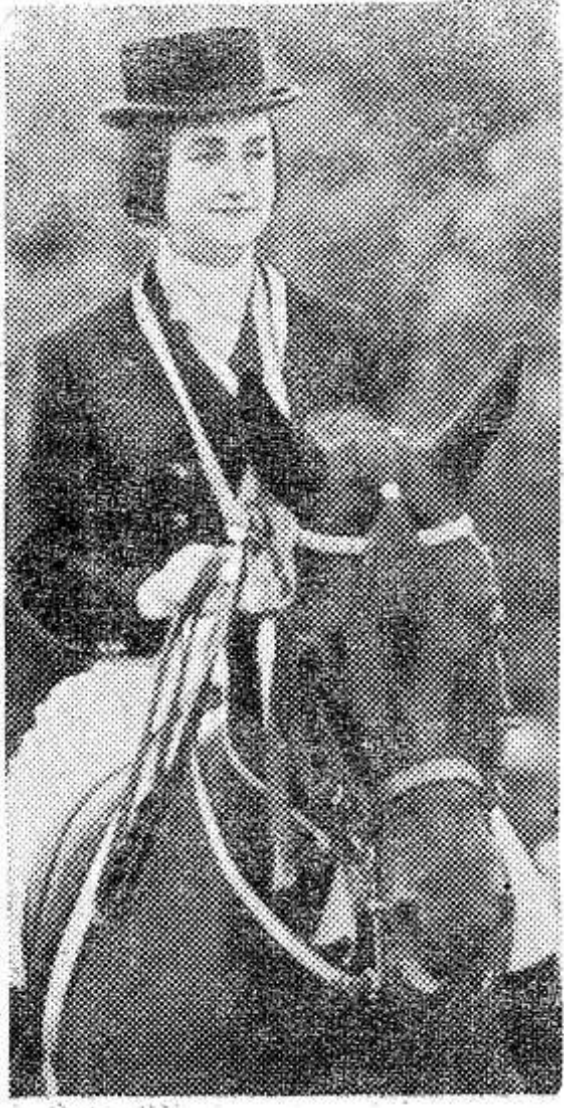
Соревнования по конному спорту. «Большой приз» по выездке.