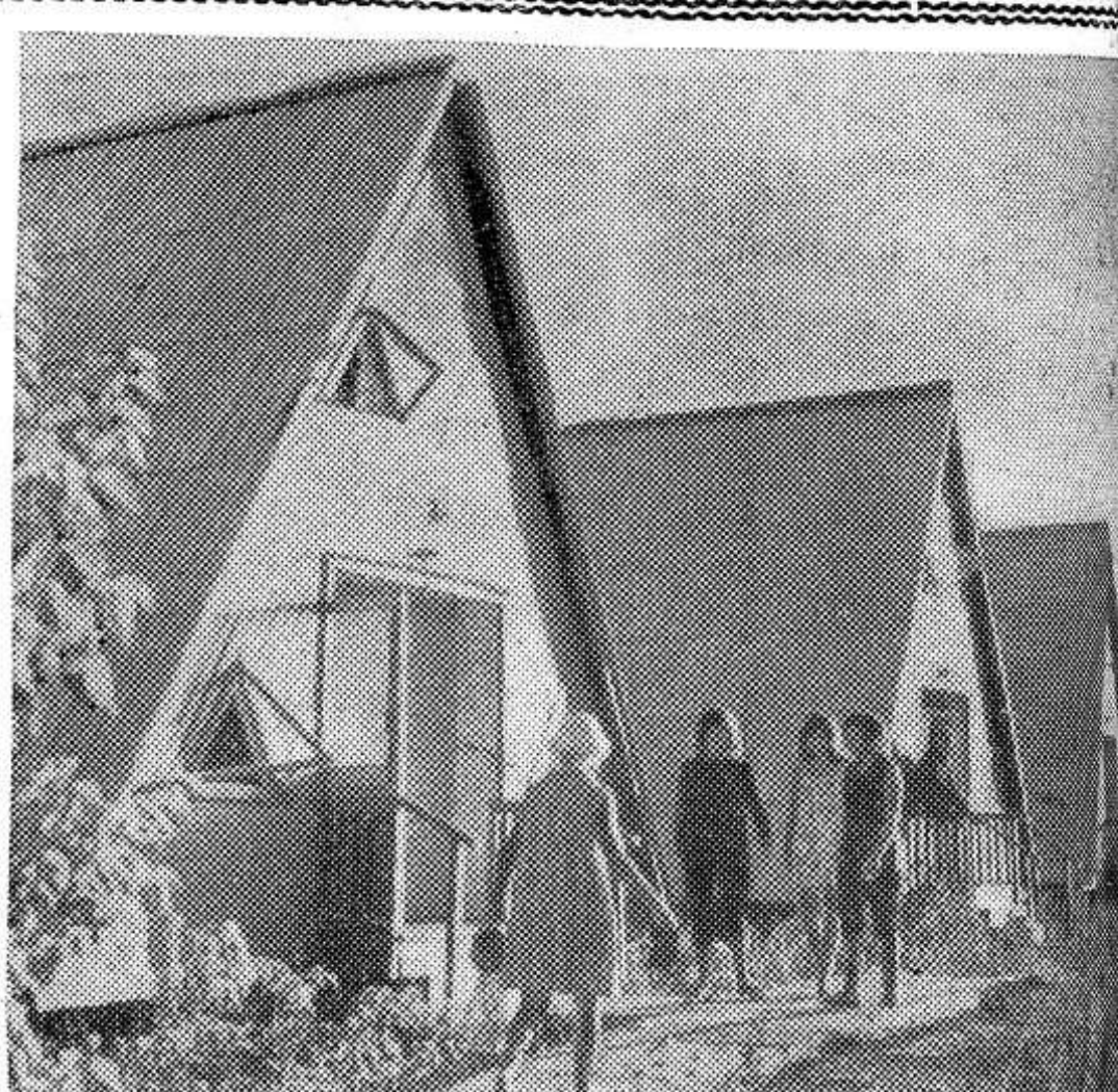
Киргизская ССР. Со всех концов Советского Союза приезжают туристы на берега Иссык-Куля, привольно раскинувшегося меж кражей Тянь-Шаня на высоте 1709 метров над уровнем моря. Любителей путешествий манит прелесть живописных ущелий, неповторимая красота седоглавых неполинов, кристально-чистые потоки горных рек.

Опочечная типография областного управления по печати. Заказ 1522. Тираж 5478