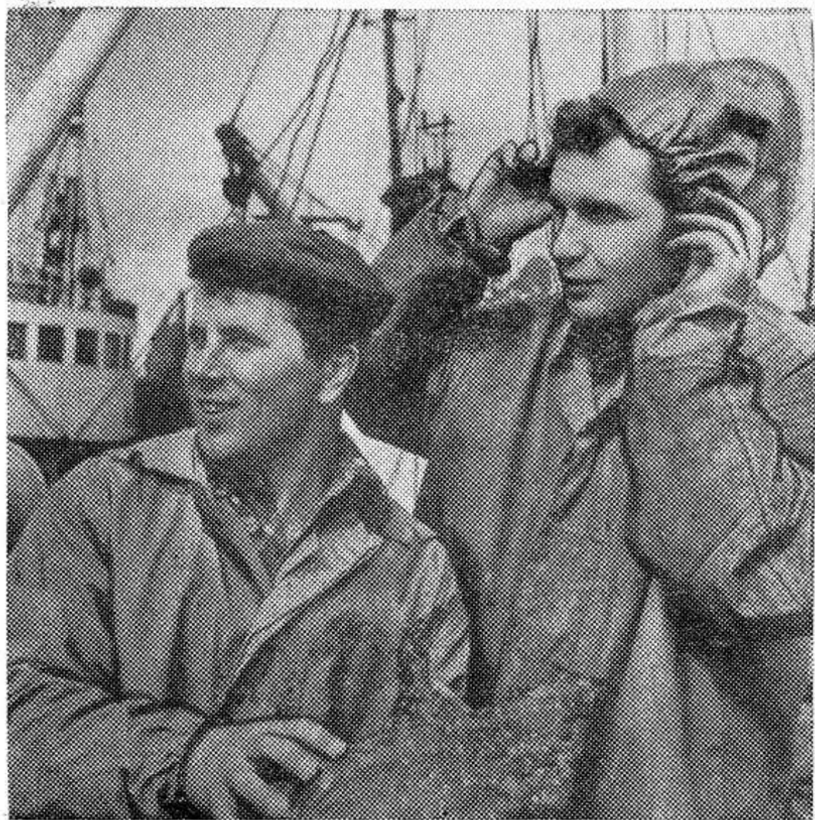
Мурманск. Экипаж рыболовного траулера «Моржовец» Мурманского «Тралфлота», готовя трудовой подарок Дню рыбака, рапортовал о досрочном завершении полугодового задания лова рыбы.