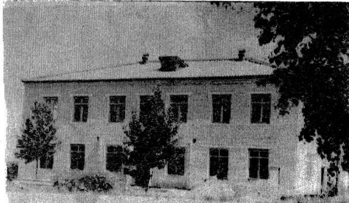
Это кирпичное здание появилось в деревне Лаптево, центре колхоза имени Любимова. Оно еще не приняло новоселов, но строители межколхозного мехотряда спешат в этом месяце завершить недоделки. В новом здании разместятся правление колхоза, служба быта, лучшее помещение отводятся под клуб. Сюда переместится и исполком сельского Совета.

рые работают трактористами, помощниками экскаваторщиков на мелиоративных объектах в хозяйствах нашего района. Н. Кузьмин.