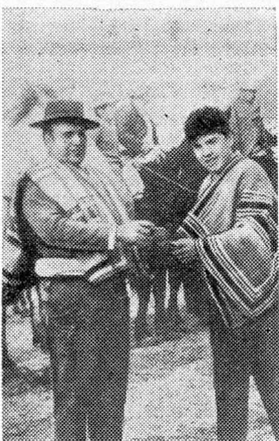
Чили. Крестьяне в национальной одежде.