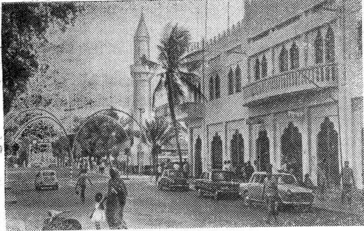
Столица Сомали Могадишо по праву считается одним из красивейших городов на африканском побережье Индийского океана.

Это шумный, по-южному пестрый и многоликий город, на улицах которого всегда ключом бьет жизнь.