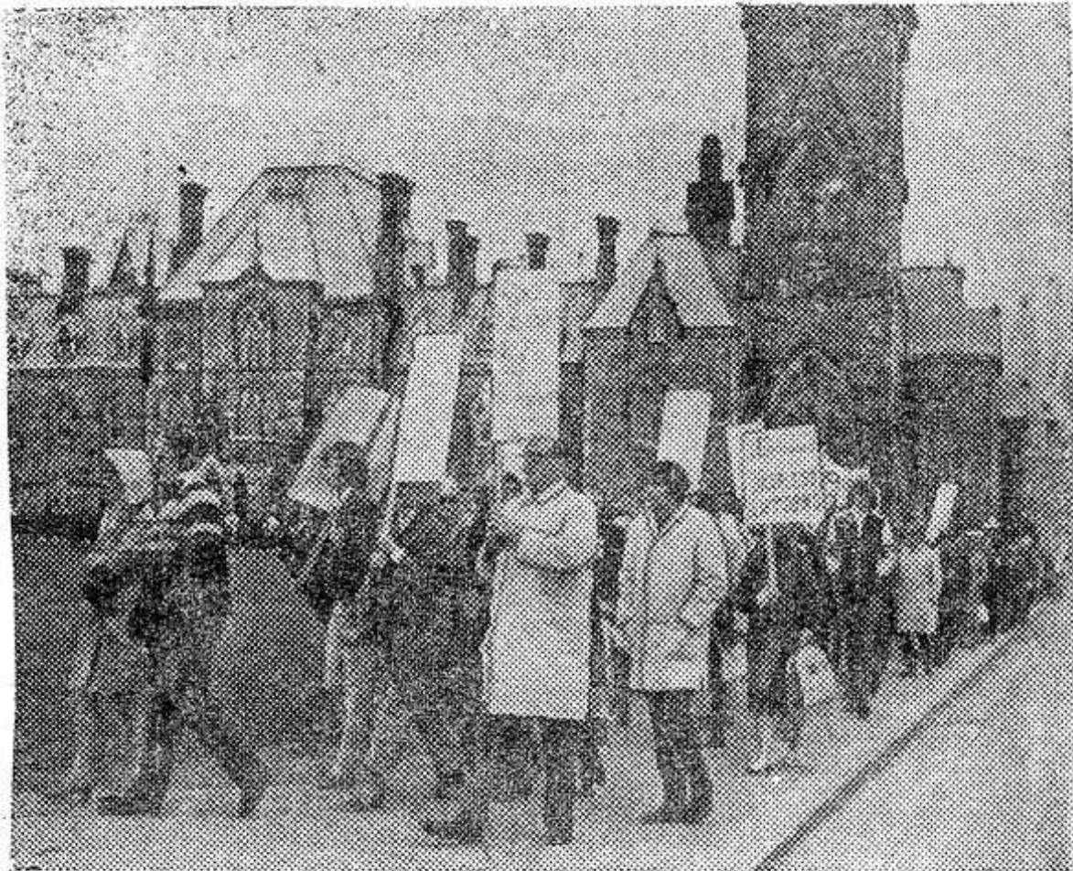
Оттава. Демонстрация протеста против закрытия в Канаде ряда предприятий, против массовых увольнений рабочих и безработицы состоялась в канадской столице перед зданием федерального парламента.

Участники манифестации потребовали от правительства принятия эффективных и неотложных мер, направленных на ликвидацию безработицы, которая достигла в стране самого высокого уровня за последние десять лет. Они выступили также за принятие мер против усиления господства в экономике американских монополий и потребовали охраны независимости и суверенитета Канады.