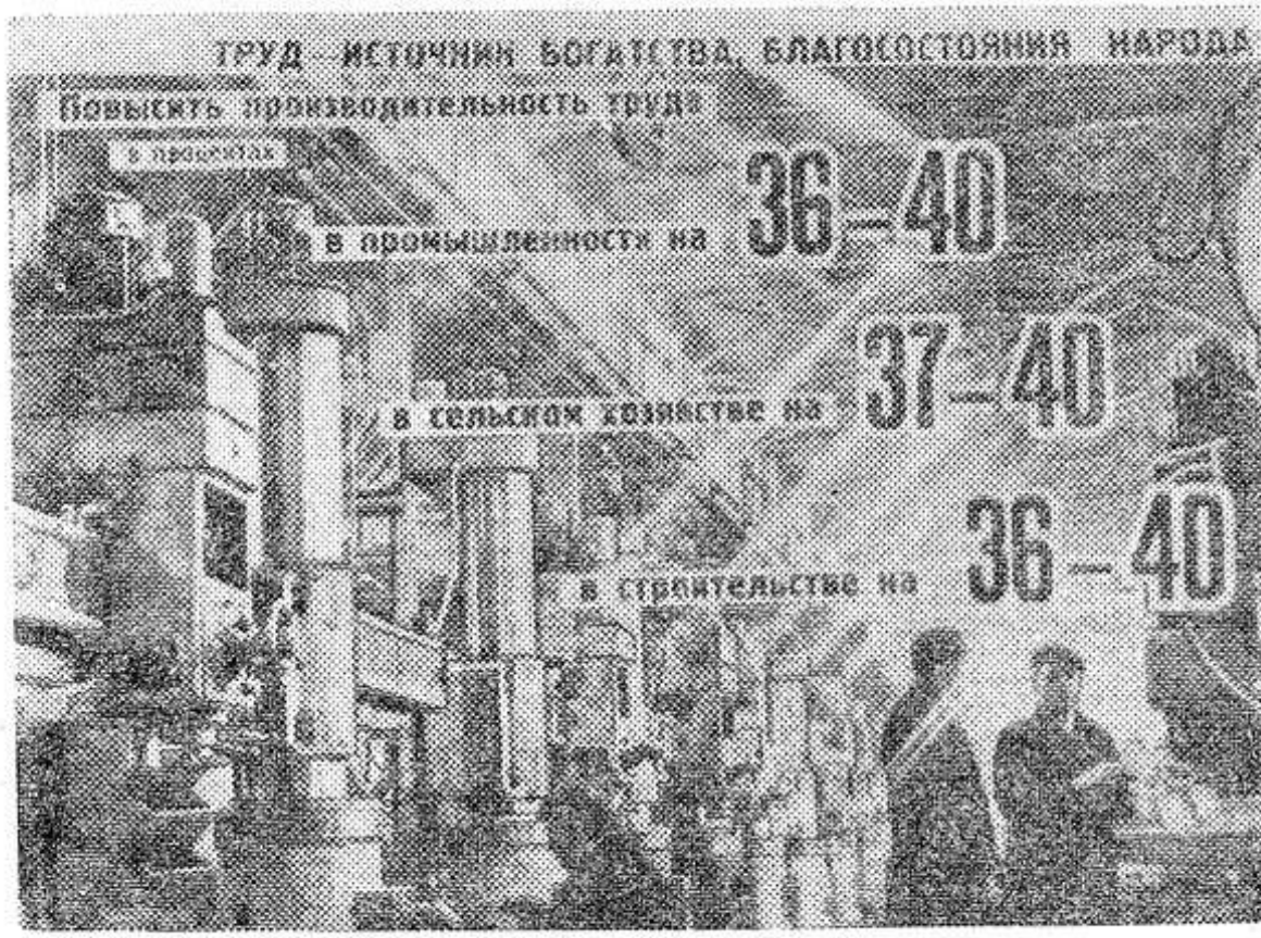
Труд — источник богатства, благосостояния народа.