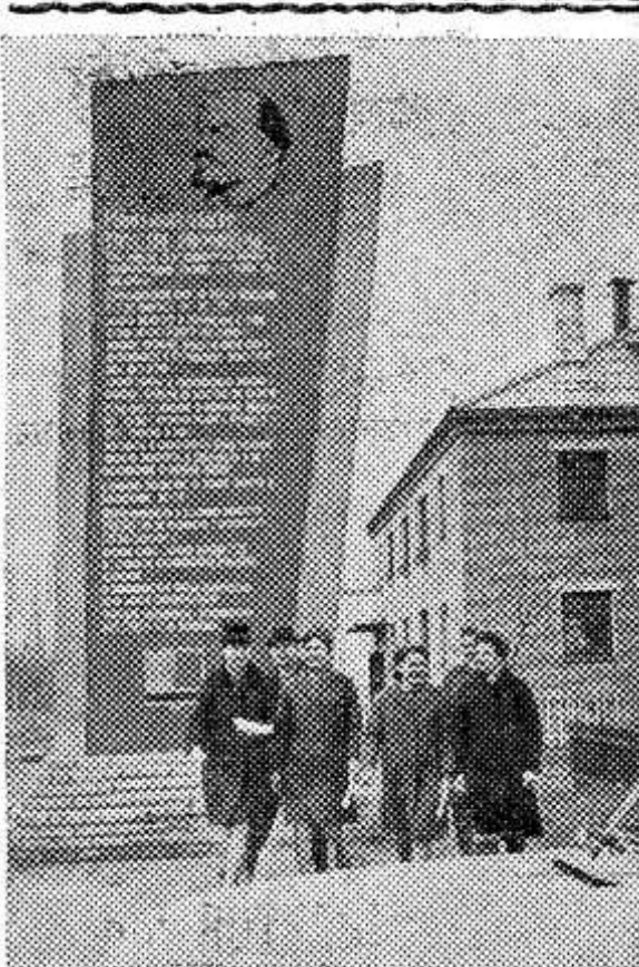
Многотысячный отряд сельских агитаторов Кустанайской области участвует в предвыборной кампании. Агитаторы разъясняют избирателям материалы XXIV съезда КПСС, рассказывают о задачах, которые стоят в новой пятилетке перед хозяйствами области, перед каждым тружеником. НА СНИМКЕ: группа агитаторов Мичуринского совхоза направляется к избирателям.

ТОТ обшир... занимающ... гектаров, в... лугами. И... по старой прив... здесь когда-... ным-давно, нес... ков лет тому на... от лугов остал... ние. А мини-ре... шая два озера... Черное, — прев... Оин ручей. «Как и всяки... чудливо петляе... ом протяжени... ром его и ра... шие луга, став... бшей своей... том. Деревья т... сплошные кочк... заходящая вес... Черного озера, «богатства» эт... Правда, паст... фермы Павел... ни не совсем... кой «оценкой»... пает здесь ск... я встретил его... влотноую подс... лоту. Коровы... самое вымя, ме... ду, изредка по... поводящаяся... — Что, Павл... скудново? — стуха. — Скудноват... ся. — Но это... будет трава, х... богатая. Всегд... по этому вот