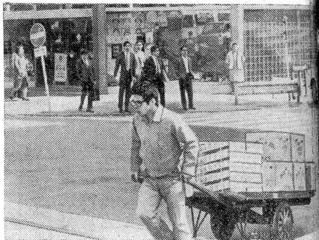
В феврале 1971 года в Японии насчитывалось 720 тысяч безработных. Поэтому приходится дорожить любой работой.

14 МАЯ 10.30 — Тематическая передача. По окончании — концерт, 17.15 — Новости, 17.30 — «На клубной сцене». Концерт участников фестиваля «Псковская весна», 18.00 — Новости, 18.05 — Тематическая передача, 19.00 — Праздничный концерт мастеров искусств, 21.00 — Репортаж о торжествах, посвященных 50-летию Грузинской ССР и Коммунистической партии Грузии, 22.30 — Чемпионат Европы по спортивной гимнастике. Мужчины, 23.00 — Концерт, 00.15 — Новости.