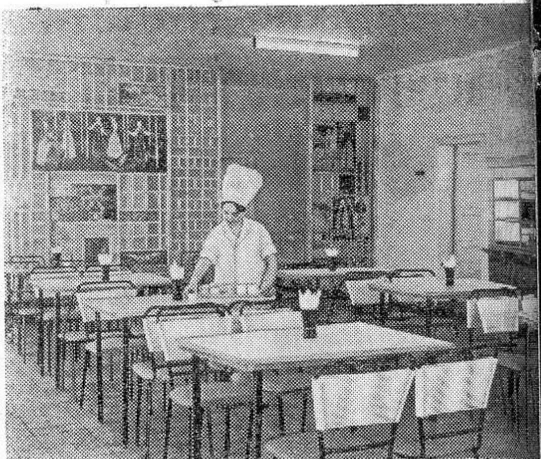
Кировская область. В деревне Спишно (центральная усадьба колхоза-миллионера «Искра» Котельничского района) недавно сдана в эксплуатацию новая столовая. Вечером она работает как кафе. НА СНИМКЕ: зал колхозной столовой.