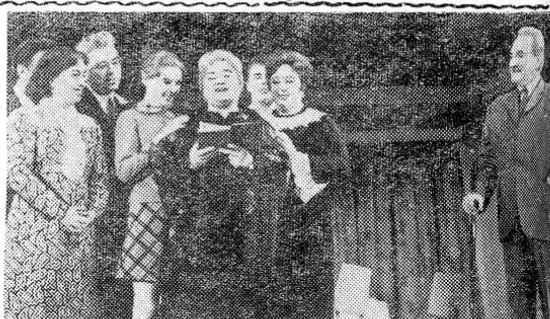
Московский драматический театр имени А. С. Пушкина поставил новую пьесу Георгия Мдивани «Большая мама». Действие происходит в наши дни. В пьесе поднимается тема о партийной чистоте и принципиальности. Спектакль поставил главный режиссер театра народный артист РСФСР Б. Н. Толмазов, оформление заслуженного художника РСФСР К. Ф. Кулешова. НА СНИМКЕ: сцена из спектакля.

Удачным был год. В соревноводов колхоза ли заняли пелично поработом году. Сделных зависел хорошо помогал. Васильевич Лстбишный перчил надой моковоры в 196 килограмма, в 1613 килогра. Нынче стоит