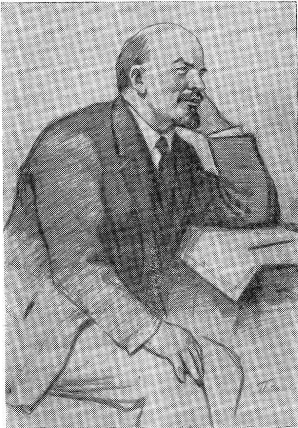
ВЛАДИМИР ИЛЬИЧ ЛЕНИН (Рисунок народного художника РСФСР П. Васильева). Фотохроника ТАСС