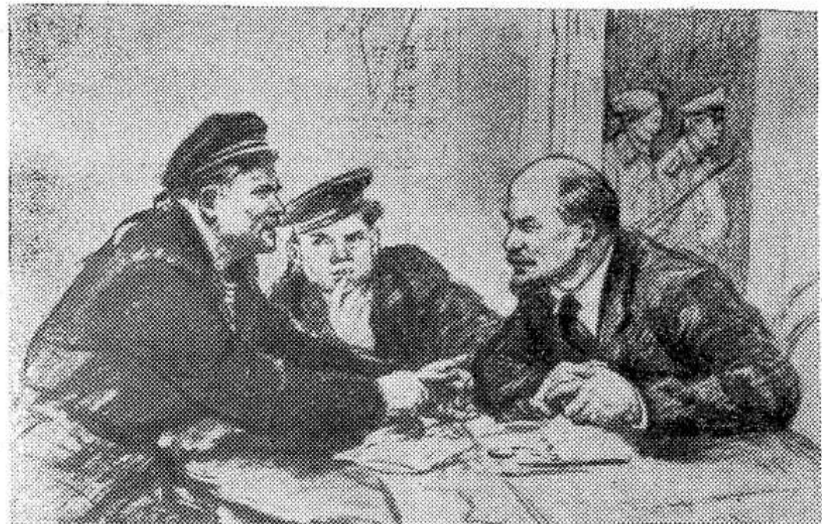
«Вести с фронта».