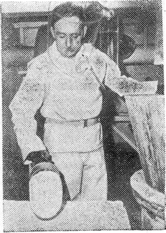
Серьезную тревогу английской общественности вызывает существование таинственного «химического» предприятия в Нэнсьюке на живописном побережье Корнуэлла (Западная Англия).