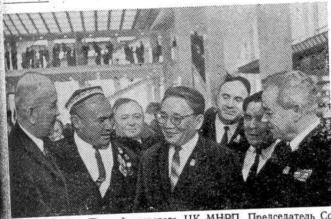
НА СНИМКЕ: Первый секретарь ЦК МНРП, Председатель Совета Министров МНР Ю. Цеденбал среди делегатов съезда.