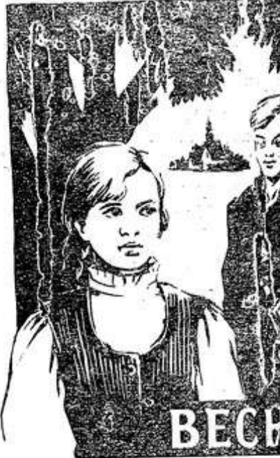
Начало сеансов в 15, 17, и 21 час.

Великолукский химлесхоз Псковского управления лесного хозяйства ПРИГЛАШАЕТ НА РАБОТУ вздымщиков и сборщиков смолы. Оплата труда сверхпремиальная. Месячная зарплата до 80 процентов среднего заработка. Сезонная премия 15 процентов от среднего заработка за сезон. Обращаться: г. Невель, Псковской области, ул. Ленина, 32.