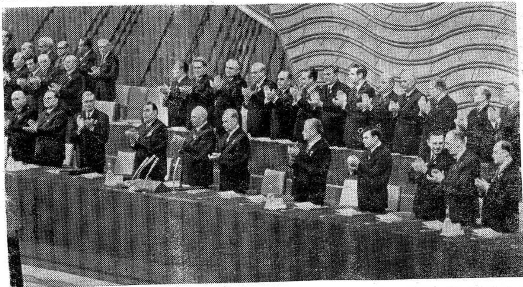
МОСКВА. XXIV съезд КПСС. НА СНИМКЕ: в президиуме съезда.

XXIV съезд КПСС продолжает работу. (ТАСС).