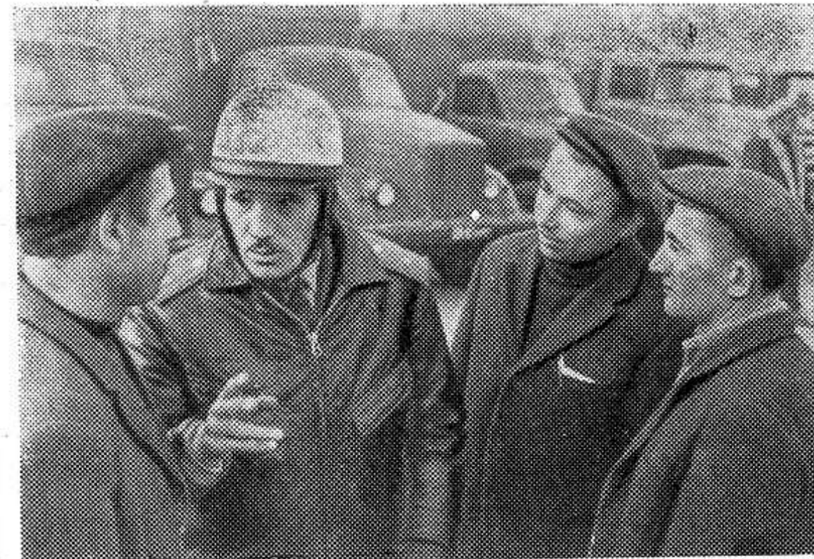
«Поставить сельскому хозяйству за пятилетие... 1.100 тыс. грузовых автомобилей...» (Из проекта Директив XXIV съезда КПСС).

Указом Президиума Верховного Совета РСФСР от 26 марта 1971 года утвержден состав Центральной избирательной комиссии по выборам в Верховный Совет Российской Федерации.