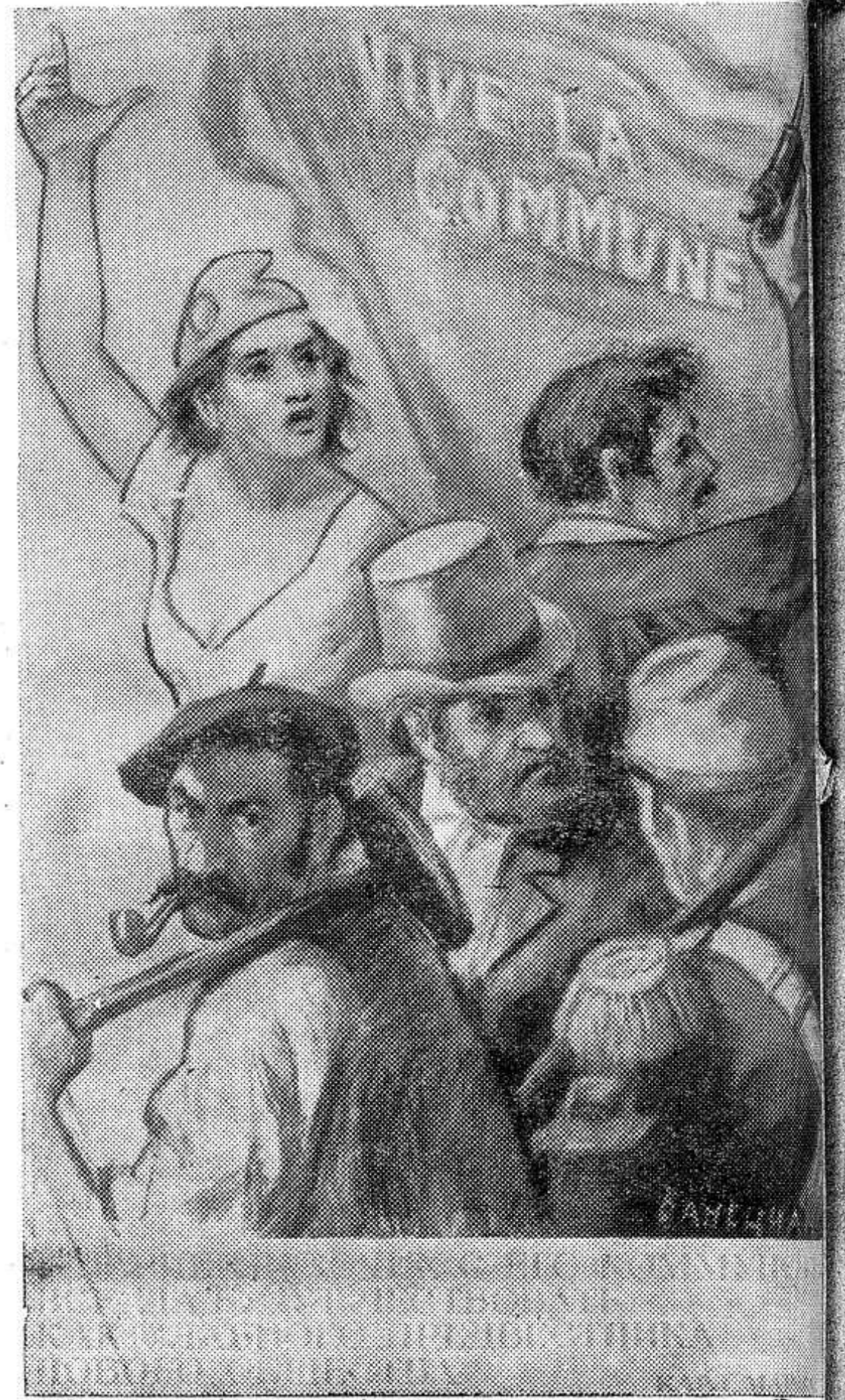
Париж рабочих с его Коммуной всегда будут чествовать как славного предвестника нового общества.

Безопасность движения требует от водителя не только вы-