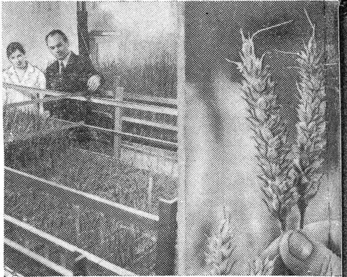
«Усилить селекционную работу по выведению новых сортов растений...» (Из проекта Директив XXIV съезда КПСС)

Красноярск. На несколько лет сокращает селекционную работу по выведению новых сортов пшеницы и ячменя лабораторная установка, созданная в институте физики имени Л. В. Киренского Сибирского отделения Академии наук СССР. Под ксенонным «солнцем» этой установки за зимний период (с октября по апрель) созревают два-три поколения гибридов пшеницы и ячменя. Летом в поле селекционер может получить третье или четвертое поколение гибридов, используемое для создания новых сортов.