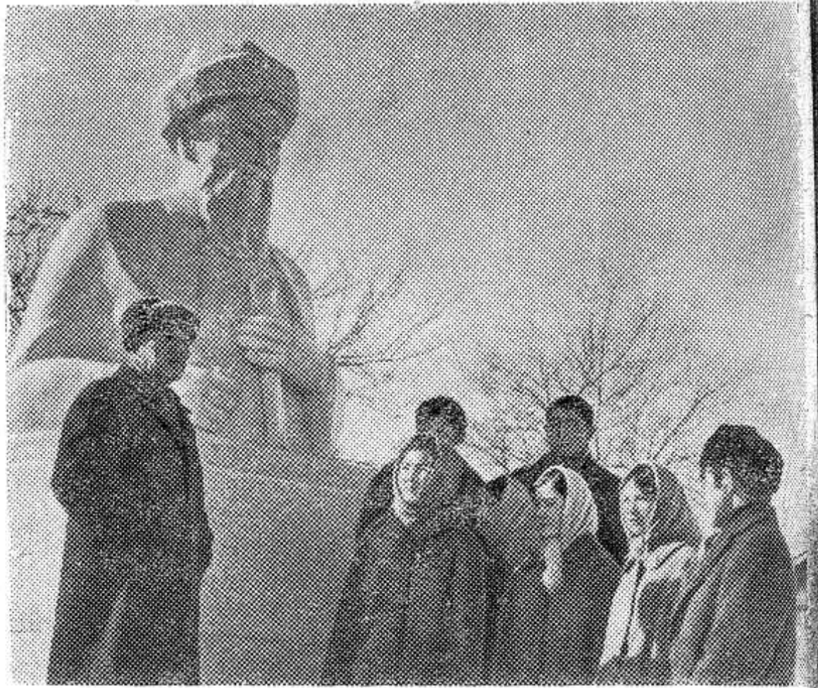
Алма-Атинская область, Джамбульский район, колхоз имени Джамбула. Литературно-мемориальный музей Джамбула Джабаева.

тивных работников, у гражданина Михайлова, брюки от костюма, купленного когда-то за 90 рублей, села в машину и в тот же день щеголяла по Опочке уже не в мини-юбке, а в брюках. Теперь был нипочем хоть тридцатиградусный мороз, но... Пришлось Страздине снять брюки, одеть снова мини-юбку и предстать перед судом. Н. Обнорский.