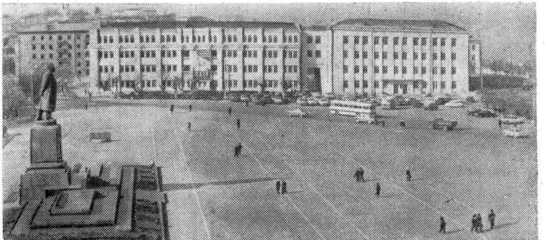
Махачкала. Площадь имени В. И. Ленина.