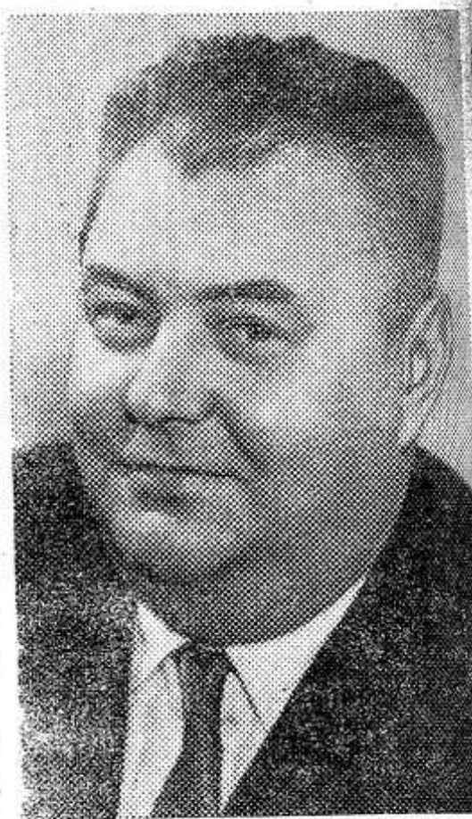
Сегодня исполняется 60 лет со дня рождения писателя и драматурга Анатолия Владимировича Софронова, автора ряда сборников стихов и широко известных пьес на современные темы «Московский характер», «Стряпуха», «Стряпуха замужем» и других. А. В. Софронов — дважды лауреат Государственной премии СССР.