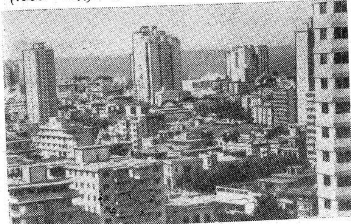
Меняется облик Гаваны, столицы Острова Свободы. Растут новые здания больниц и школ, многоквартирные жилые дома, комфортабельные гостиницы. Городские трущобы полностью ликвидированы. НА СНИМКЕ: столица Республики Кубы — Гавана.

1 ЯНВАРЯ — ПОБЕДА КУБИНСКОЙ РЕВОЛЮЦИИ (1959 ГОД). ДЕНЬ ОСВОБОЖДЕНИЯ КУБЫ