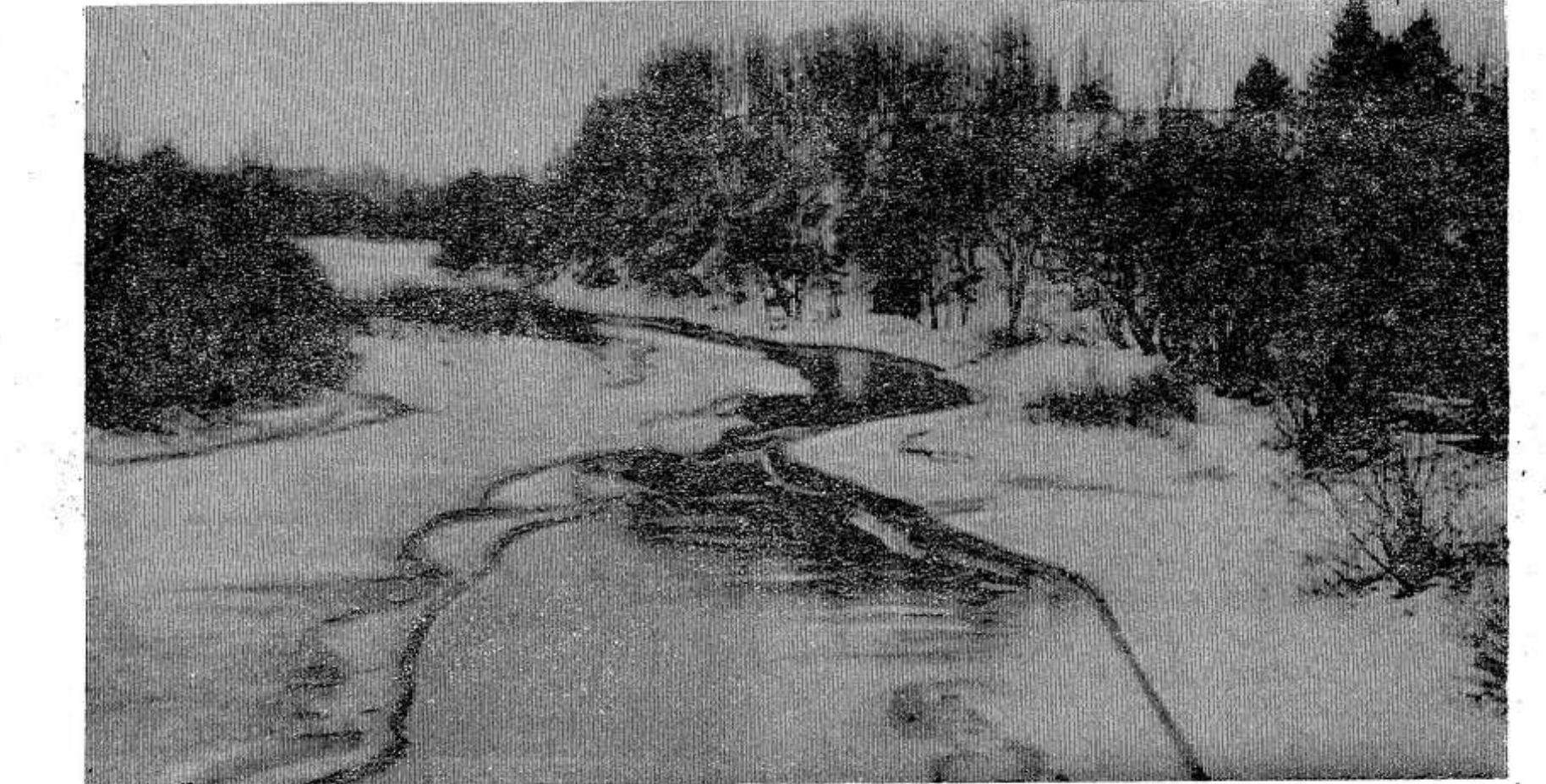
Зима вступает в свои права.

«Будильник». 10.00 — Переключ- ка Волгограда и Минска. 10.30 — Программа Сыктывкарской сту- дии телевидения. 12.00 — Для детей. «Энтель-гентель». Новогод- няя музыкальная развлекатель- ная передача. 12.30 — «Музы- кальный киоск». 13.00 — «Энер- госистема «Мир». 13.30 — Для школьников. «Три дня без под- сказки». Ответы на вопросы вто- рого тура олимпиады по физике. 14.25 — «Капитанская дочка». Худ. фильм. 16.00 — «Труженники села». Молдавская ССР. 16.30 — Для воинов Советской Армии и Флота. 17.00 — «Клуб кинопу- тешественников». 18.00 — Новости. 18.05 — «Годы борьбы и победы». К 50-летию Компартии Франции. 19.00 — А. Куприн. «Впотьмах». Телеспектакль. 20.15 — «Время». 20.45 — «Мама вышла замуж». Худ. фильм. 22.10 — Докумен- тальный фильм. 22.45 — Новости. 28 ДЕКАБРЯ 17.00 — «Оперные театры страны». 18.05 — Для школьни- ков. «Пионерия». 18.30 — «Косми- ческие старты года». 19.00 — «Эксперимент». Музыкальная ко- медия. 20.30 — «Время». 21.00 — «Театральные встречи». «Когда горит елка». 22.15 — «Пробле- мы и события». Комментарий по- литического обозревателя Вал. Зорина. 22.30 — «Спортивный дневник».