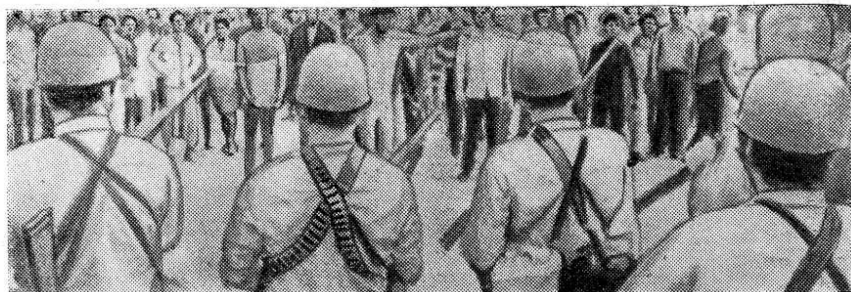
В Соединенных Штатах продолжаются выступления негров против дискриминации негритянского населения страны.