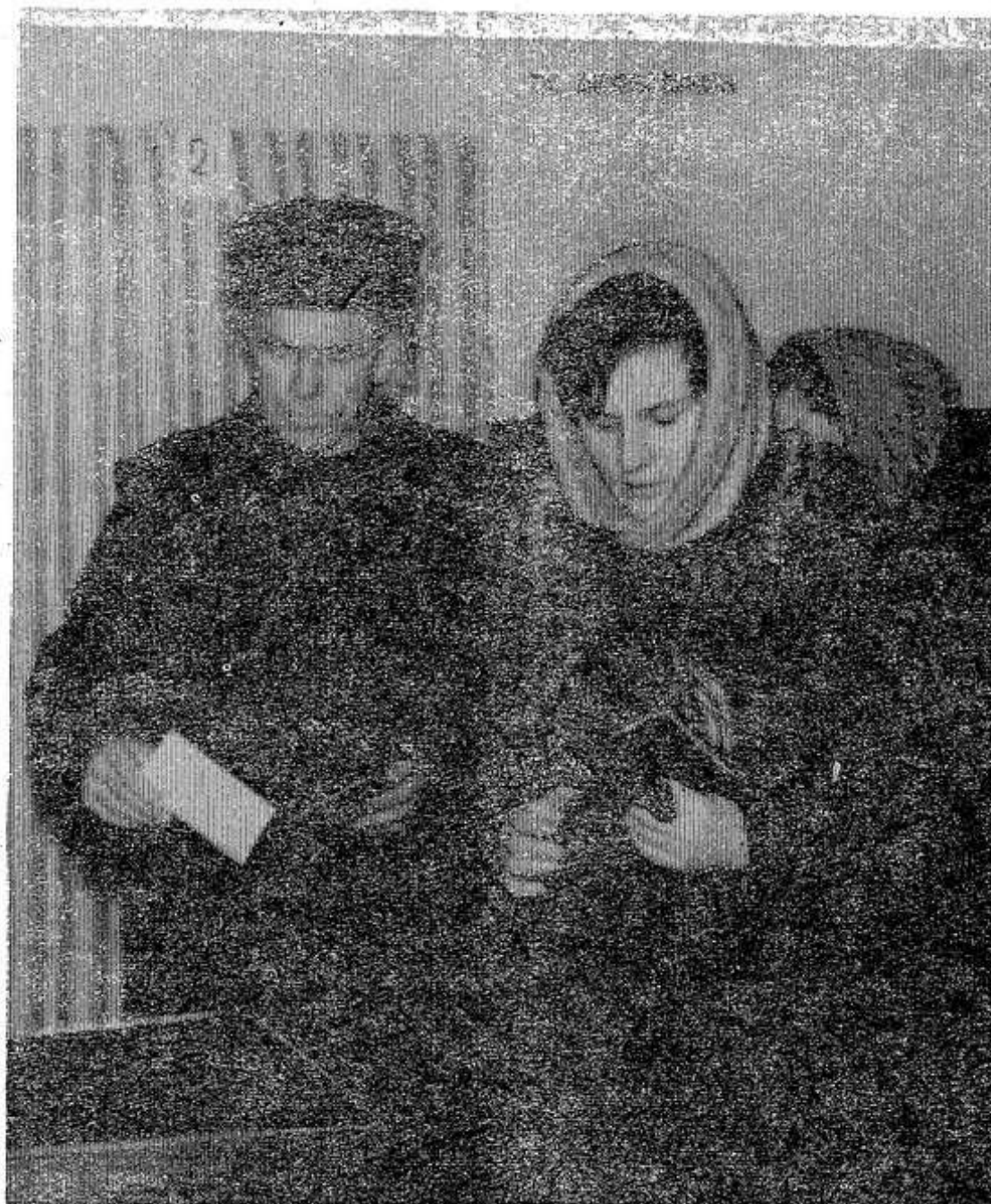
На этом снимке запечатлен момент голосования на Завеличенском избирательном участке.

НАШ район выступил нынче инициатором соревнования за досрочное выполнение государственного плана по продаже льнопродукции. В обязательствах было предусмотрено справиться с заданием к 15 декабря. Но слово свое льноводы района не сдержали. По оперативным данным, на 13 декабря продано государству 9790 центнеров волокна из 12460 центнеров по плану. Задание выполнено на 78,5 процента. За минувшую неделю прибавка составила всего 42 тонны волокна, то есть хозяйства района доставляли на завод в среднем по шесть тонн продукции в день.