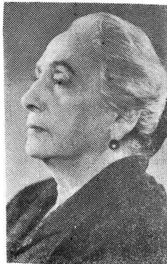
менный пропагандист, идей марксизма-ленинизма, неутомимый борец за дело пролетарского интернационализма, за мир во всем мире.

Завтра исполняется 75 лет со дня рождения Председателя Коммунистической партии Испании Долорес Ибаррури. Ее псевдоним и партийное имя Пасноария («Пламенная») стало символом не только борьбы испанского народа против фашизма, но и символом борьбы народов всего мира против реакции за свободу. Огромный талант Пасноарии как одного из крупнейших организаторов масс и народного трибуна особенно проявился в годы национально-освободительной борьбы испанского народа против реакционеров и объединенных сил интервентов фашистской Италии и гитлеровской Германии (1936—1939 гг.). Ее замечательные слова «Лучше умереть стоя, чем жить на коленях» и «Но пассаран!» («Они не пройдут!») стали боевыми лозунгами испанских борцов за свободу, воодушевляли бойцов. Д. Ибаррури — верный друг Советского Союза, пла-