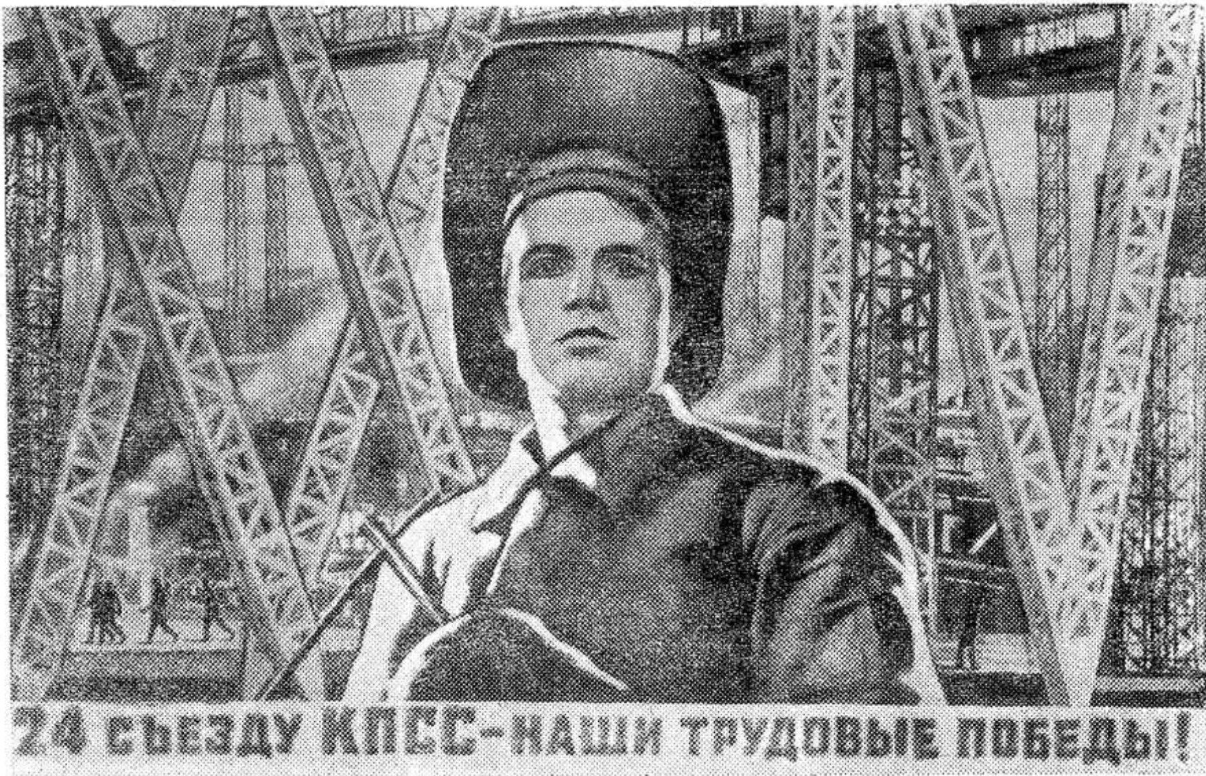
24 съезду КПСС — наши трудовые победы!

Плакат художника В. Корецкого (издательство «Изобразительное искусство»).