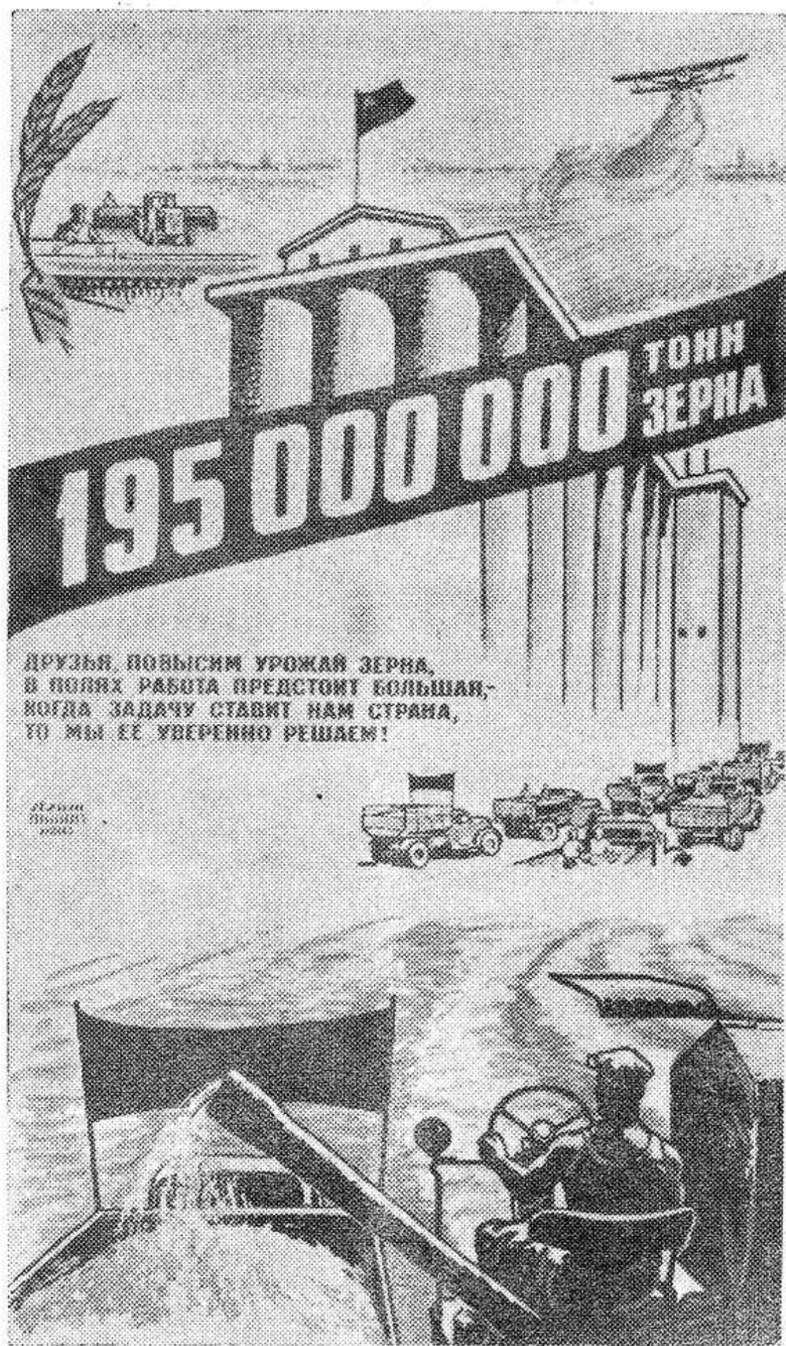
Друзья, повысим урожай зерна, в полях работа предстоит большая, когда задачу ставит нам страна, то мы ее уверенно решаем!

Учить слушателей творческому овладению революционной теорией, добиваться ясного понимания и правильного применения ее положений в жизни — высокий долг внештатного пропагандиста.