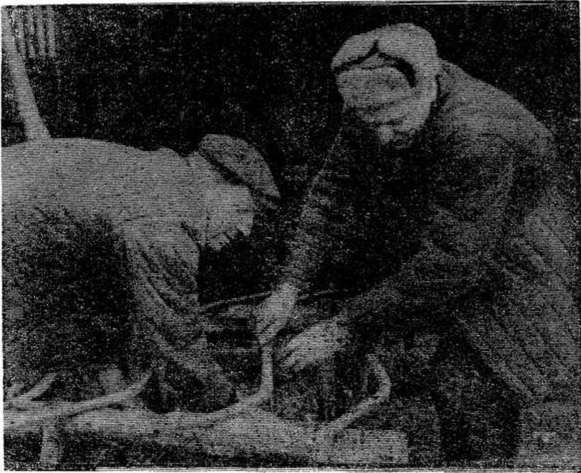
Каждый раз, приезжая в деревню Ладыгино колхоза «За-

веты Ленина», обращаешь внимание на маленький, с почерневшими бревнами домик. Это колхозная кузница. Круглый год оттуда доносится звон железа.