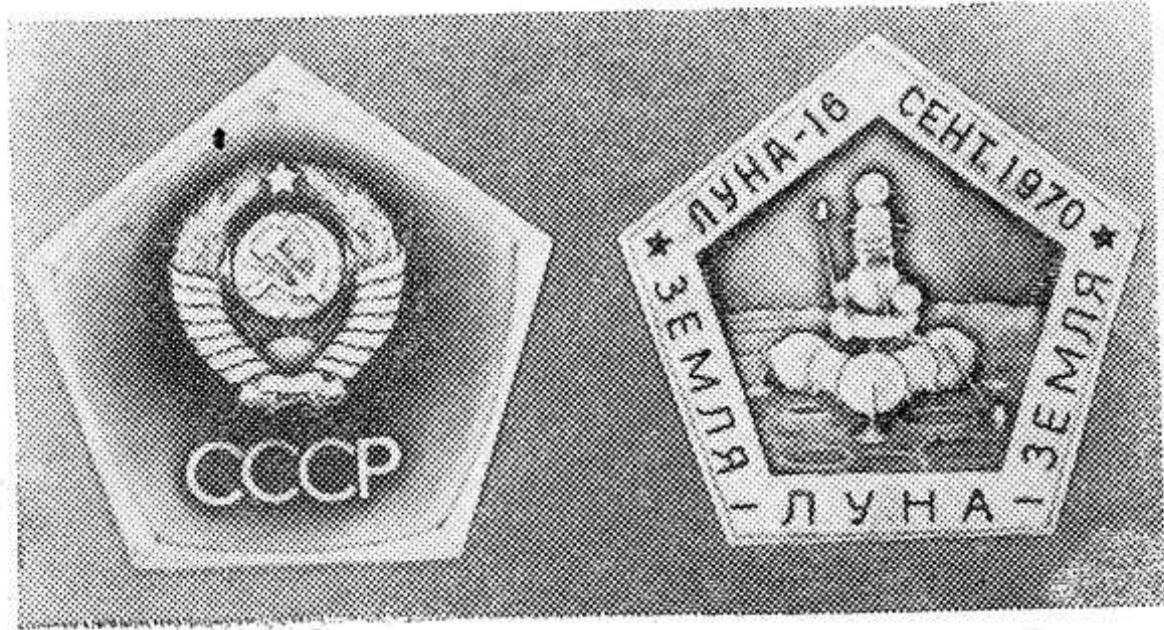
НА СНИМКЕ: Государственный знак СССР, побывавший на Луне и возвращаемый на Землю.