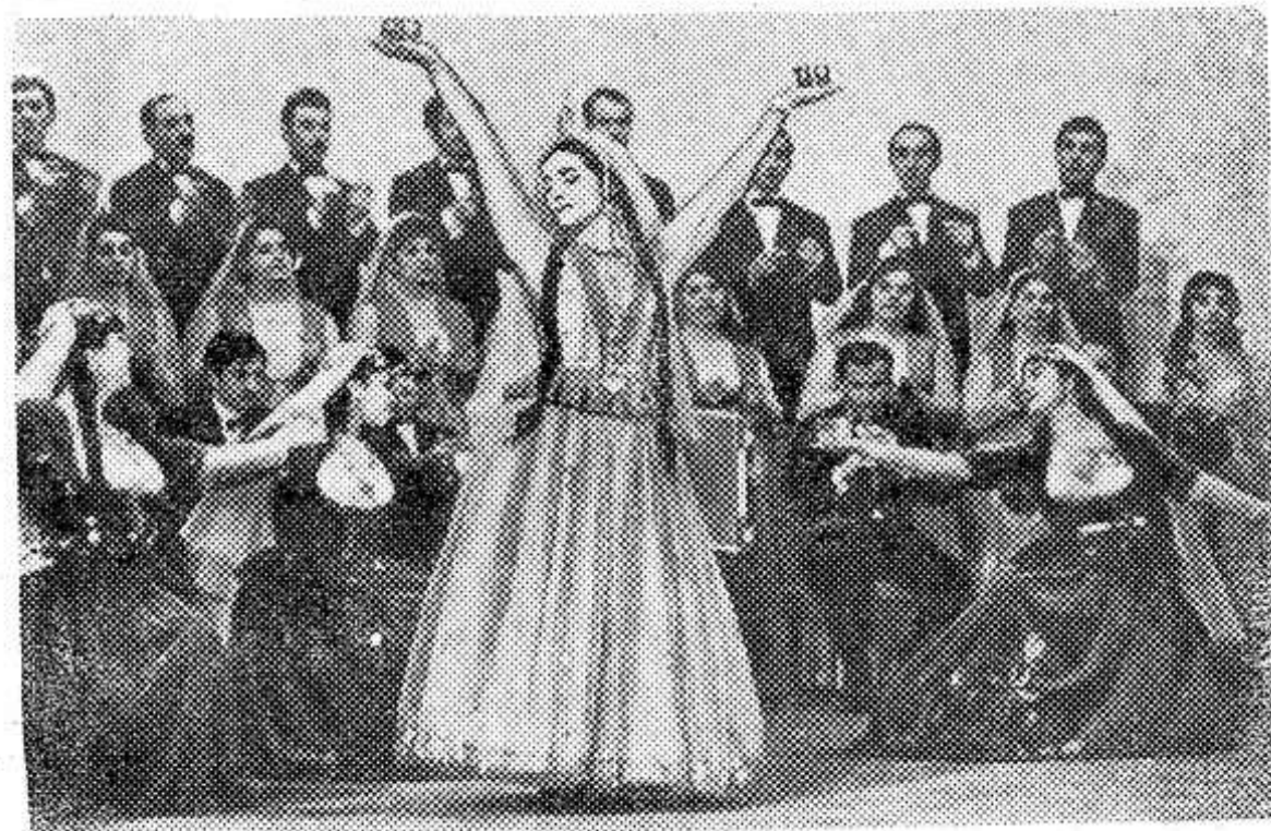
Выступает республиканский ансамбль песни и танца.