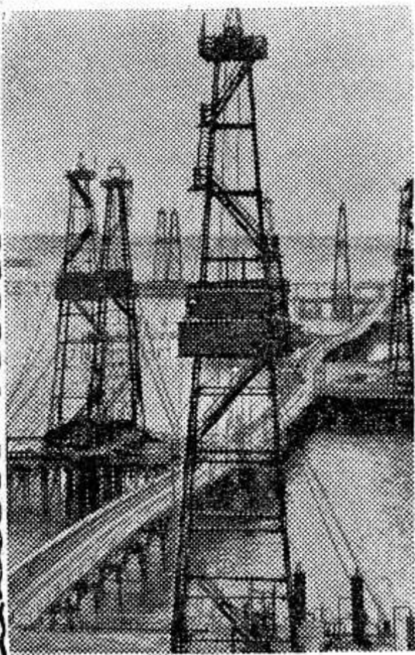
НА СНИМКЕ: морской промысел НПУ имени Серебровского.

Коллектив коммунистического труда первого промысла НПУ имени Серебровского, используя внутренние резервы и улучшив технологию эксплуатации скважин, с начала года добыл сотни тонн сверхплановой нефти и более 200 миллионов кубических метров газа.