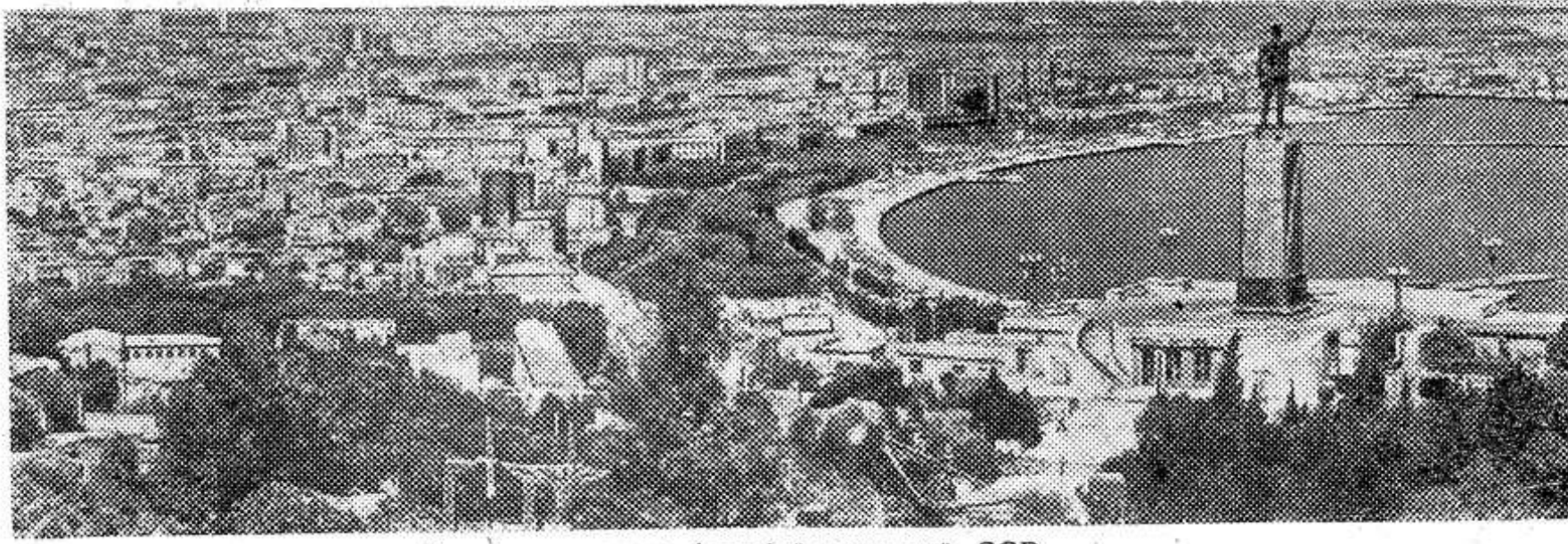
Баку — столица Азербайджанской ССР.

Коллектив коммунистического труда первого промысла НПУ имени Серебровского, используя внутренние резервы и улучшив технологию эксплуатации скважин, с начала года добыл сотни тонн сверхплановой нефти и более 200 миллионов кубических метров газа.