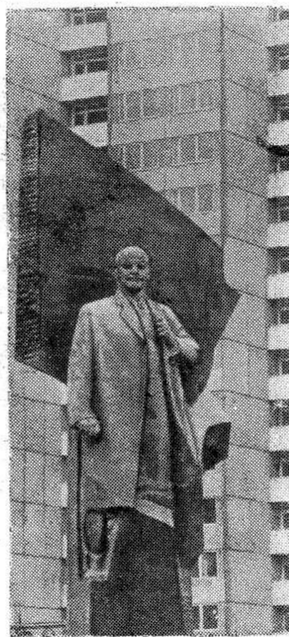
БЕРЛИН. Памятник Владимиру Ильичу Ленину был открыт недавно в столице ГДР. Он сооружен по проекту советского скульптора народного художника СССР Н. В. Томского.