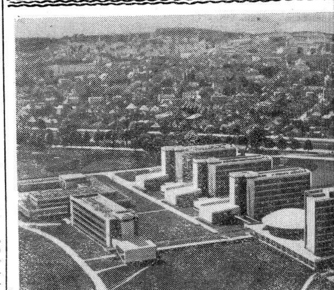
ЧССР. В живописной местности у города Нитра в Восточной Словакии расположен новый учебный центр — высшая сельскохозяйственная школа. Лаборатории, аудиторный кор-