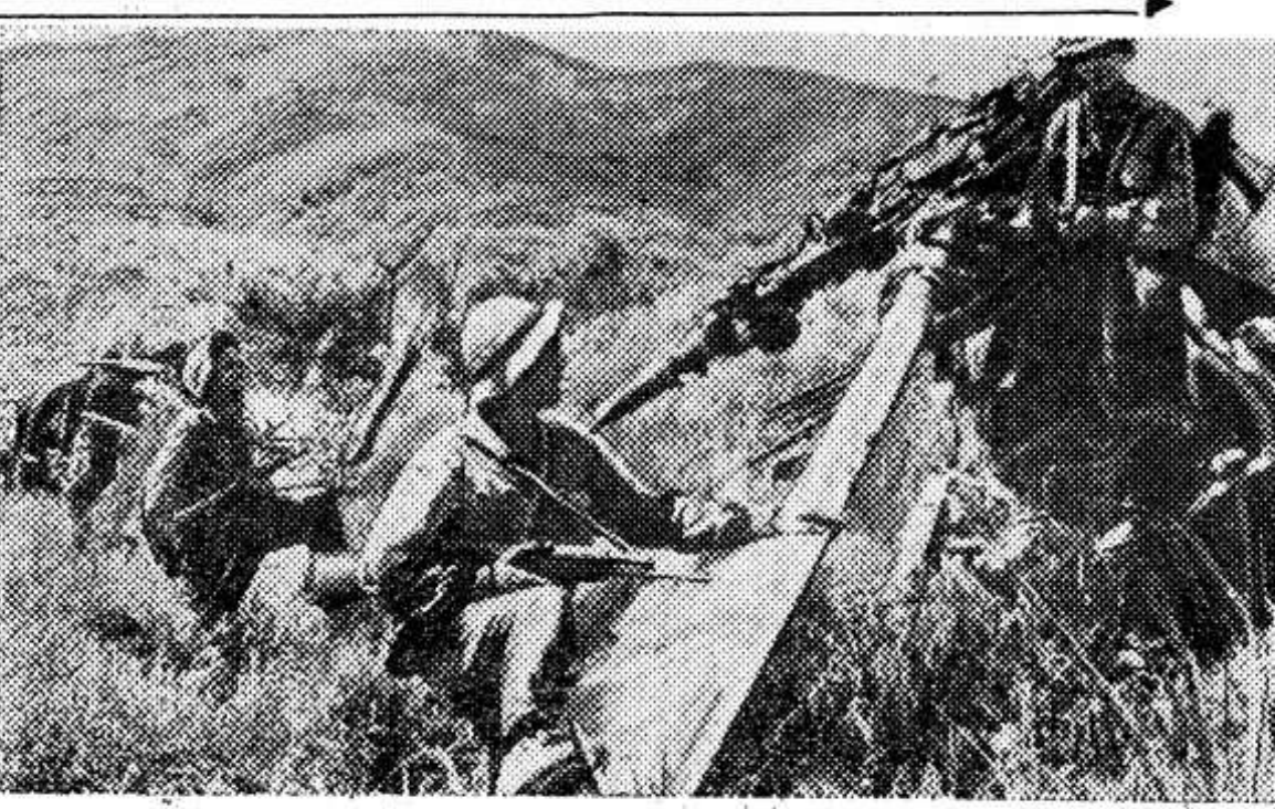
ЮЖНЫЙ ВЬЕТНАМ. Бойцы Народных вооруженных сил освобождения осматривают обломки сбитого ими американского вертолета в провинции Куангчи.

Опочечкая типография областного управления по печати. Заказ 1996 Тираж 5503