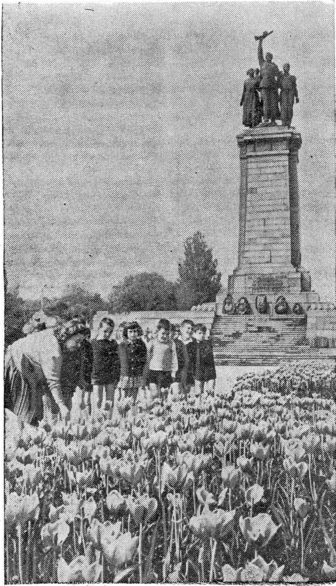
Монумент в честь Советской Армии — освободительницы, установленный в Софии — столице Народной Республики Болгарии.