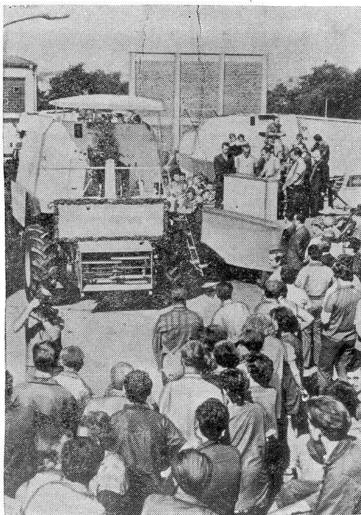
Новая высокопроизводительная сельскохозяйственная техника работает на полях Германской Демократической Республики. НА СНИМКЕ: коллектив комбината «Фортшритт» (округ