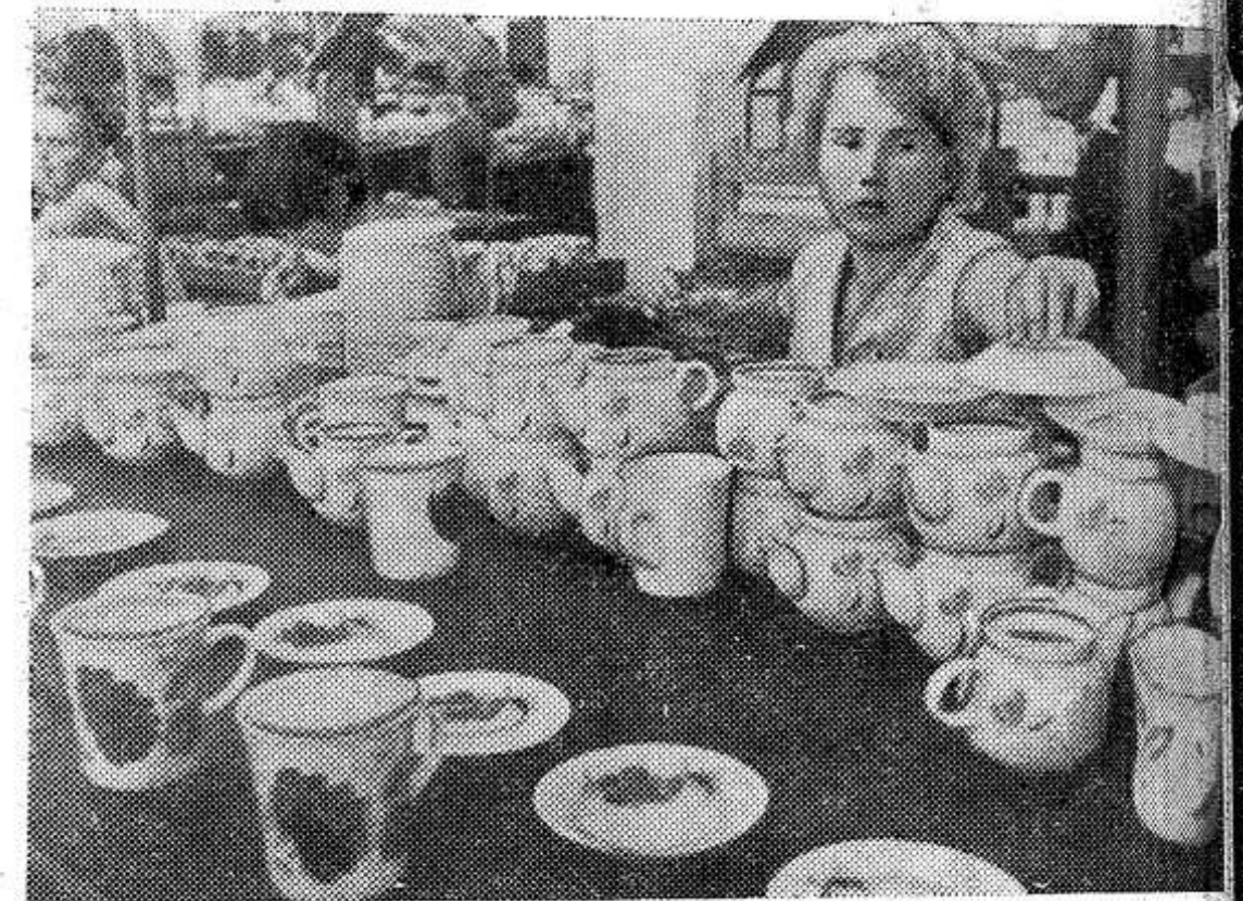
ИРКУТСКАЯ ОБЛАСТЬ. Посуда и сувениры Хайтинского фарфорового завода пользуются большим спросом у покупателей. 15 миллионов изделий сходит с его конвейера в год. Большинство изделий разработаны заводскими художниками и ра-