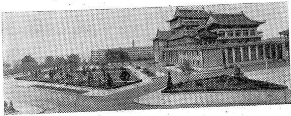
ПХЕНЬЯН. С любовью корейский народ восстановил свою столицу. Ныне Пхеньян — один из самых красивых городов. НА СНИМКЕ: площадь перед зданием Большого театра.