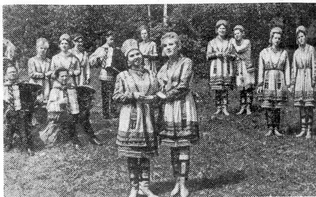
САРАНСК. Выступления Мордовского государственного ансамбля песни и танца «Умарина» пользуются большим успехом у зрителей. Участники художественного коллектива часто бывают на гастролях в колхозах и совхозах республики.