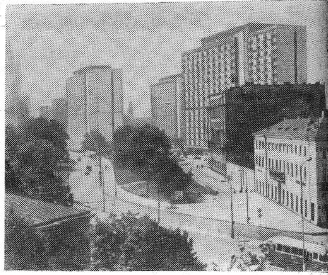
На снимке: центральная часть Варшавы.