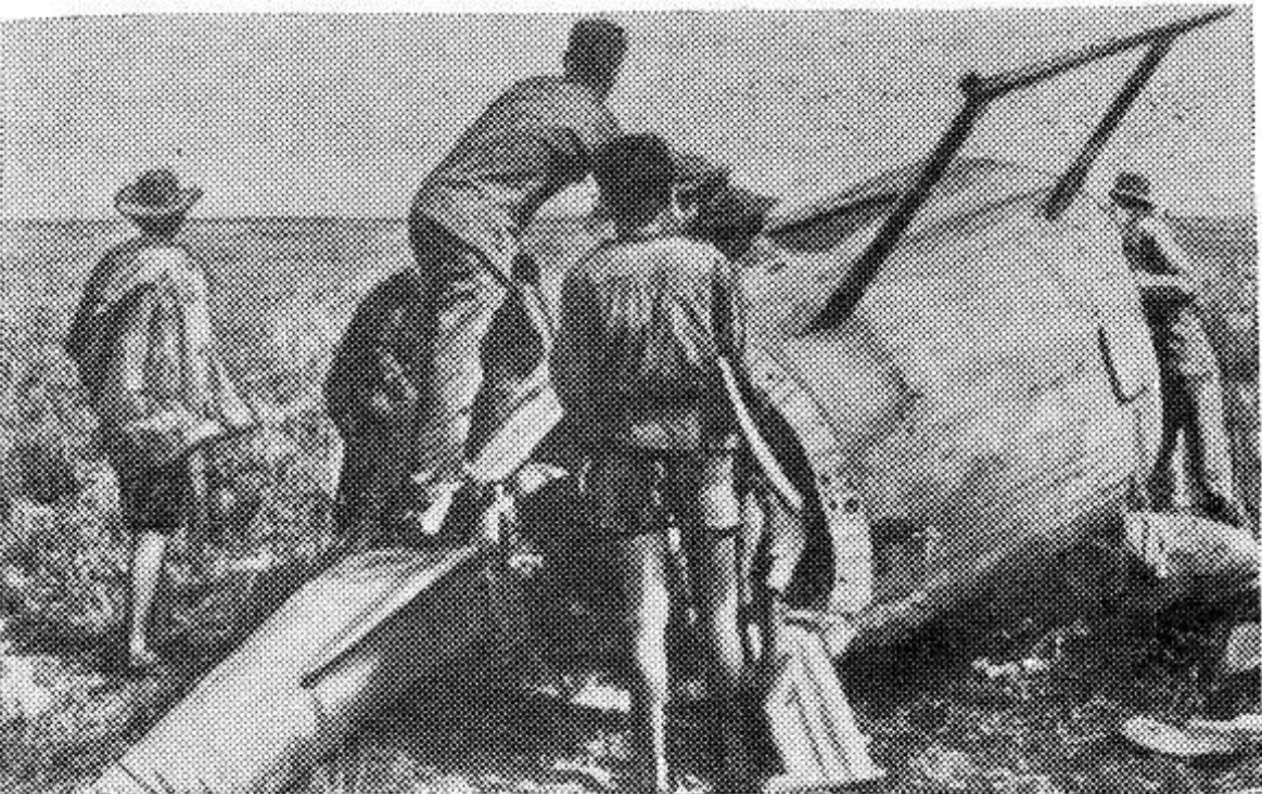
ЮЖНЫЙ ВЬЕТНАМ. Бойцы Народных вооруженных сил освобождения продолжают успешные боевые действия против американской военщины и их сайгонских марионеток. НА СНИМКЕ: этот вертолет был сбит метким огнем патриотов.