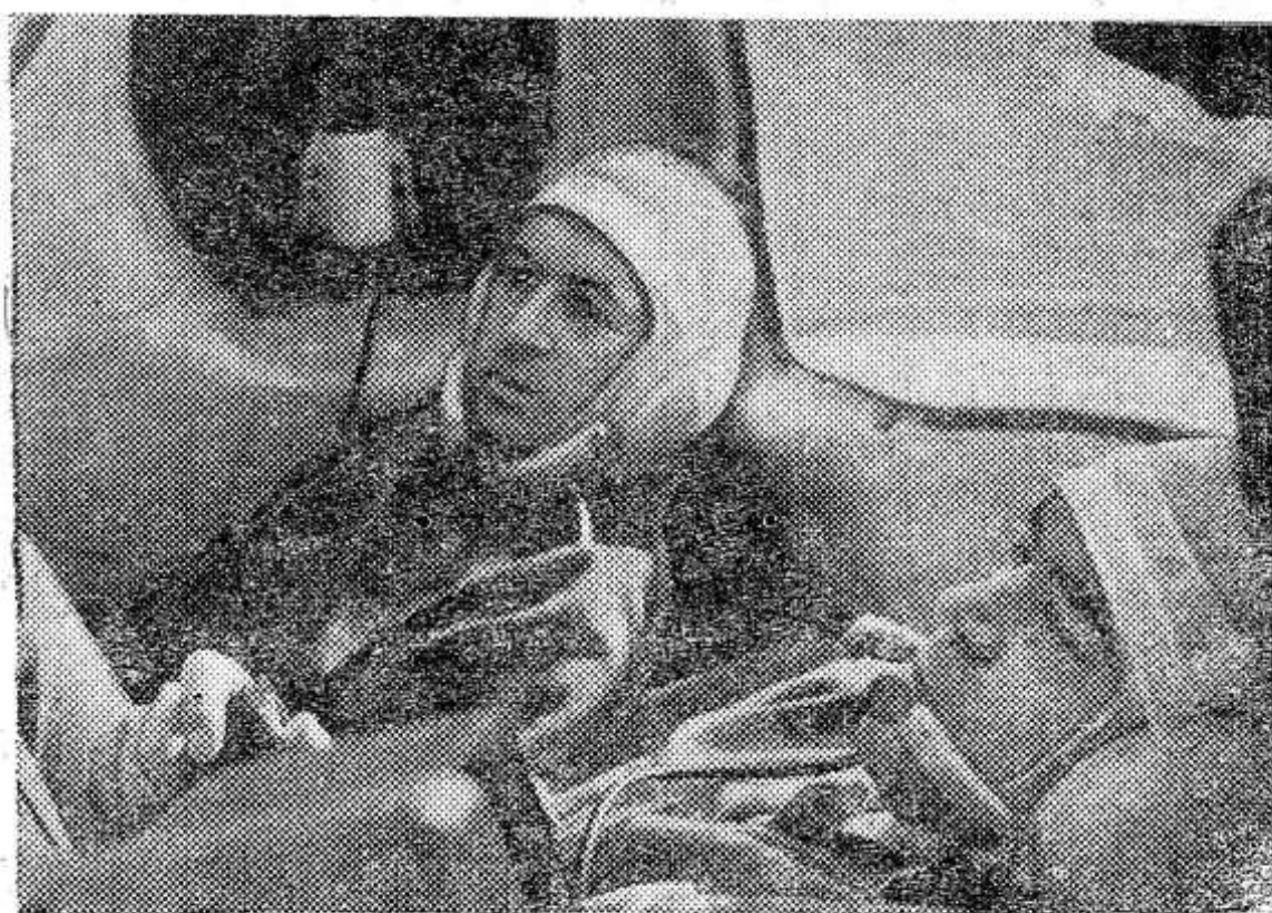
Командир космического корабля «Союз-9» А. Г. Николаев (на переднем плане) и бортиженер В. И. Севастьянов на тренировках.

Самочувствие экипажа хорошее, настроение рабочее.