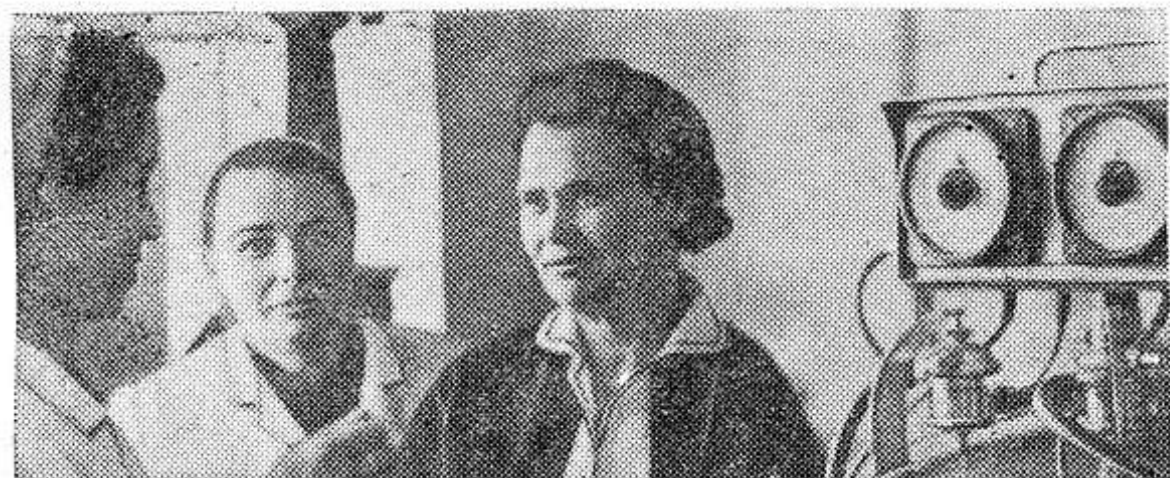
Среди кандидатов в депутаты Верховного Совета СССР, названных коллективами трудящихся Московской области, —