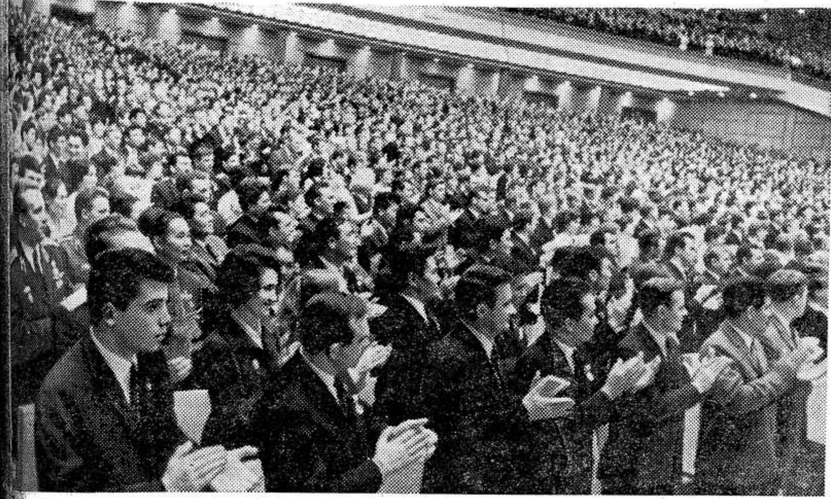
НА СНИМКЕ: во время заседания в Кремлевском Дворце съездов.