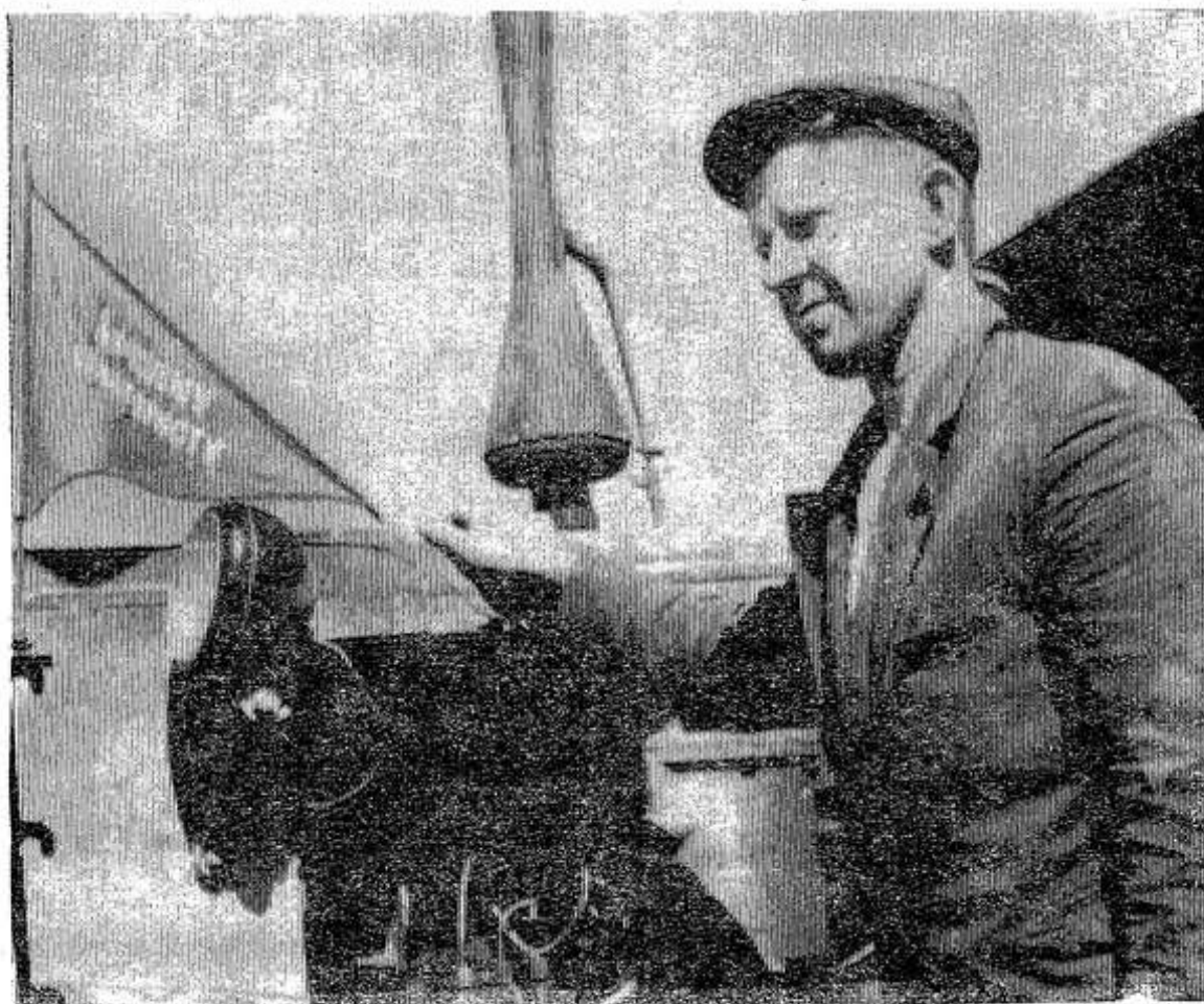
По-ударному трудятся механизаторы совхоза «Глубоковский». Из 1800 гектаров ярового клина ими посеяно свыше тысячи. Быстрыми темпами ведется и посадка картофеля.